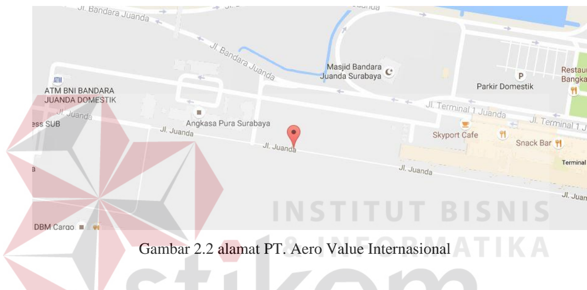
Gambar 2.2 alamat PT. Aero Value Internasional

PT. Aero Value Internasional terletak di Juanda, Sidoarjo, 61235, Indonesia