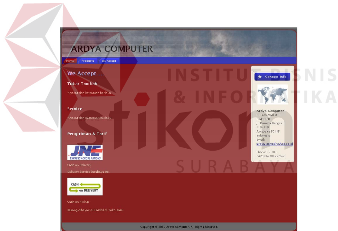
Gambar 4.1 Halaman Information Web Ardy Computer