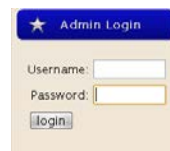
Gambar 4.2 Kolom Admin