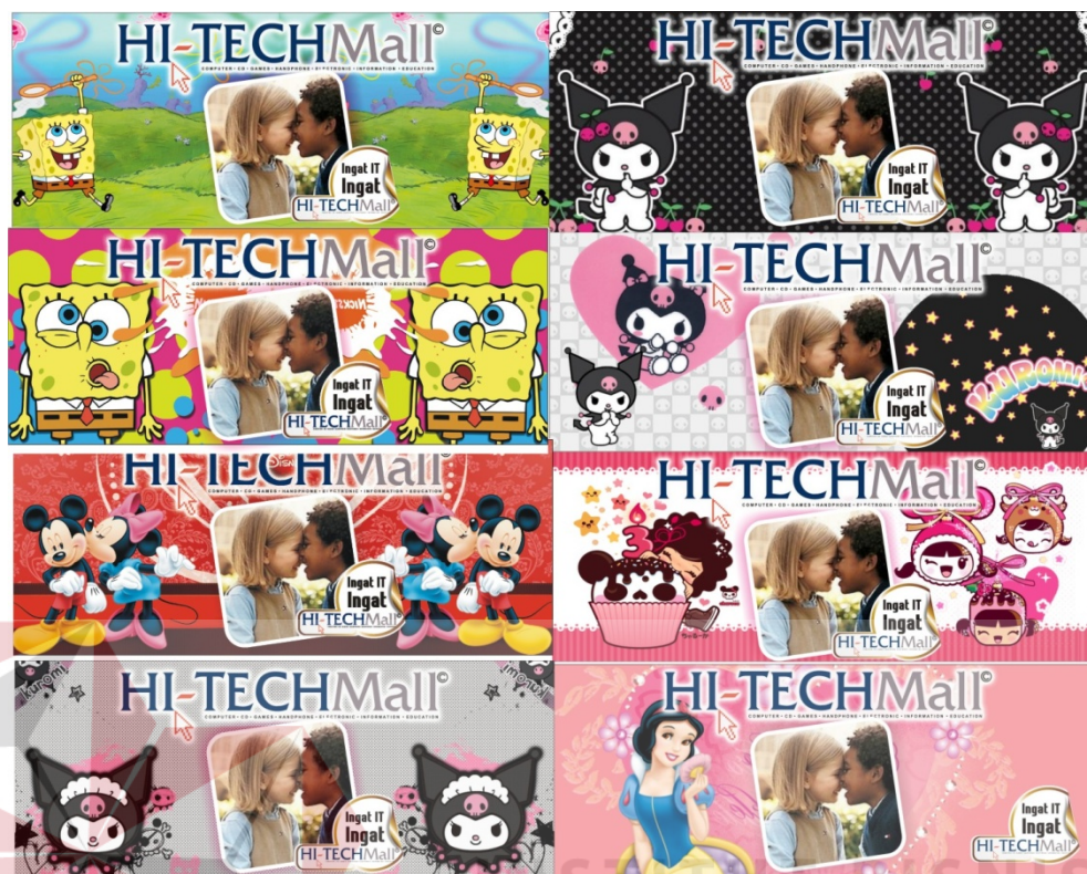
Gambar 4.4 Beberapa Hasil Jadi Desain Mug