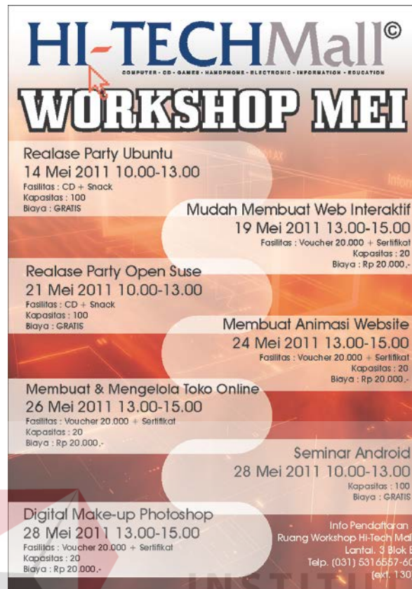
Gambar 4.2 Hasil Jadi Poster Workshop Mei