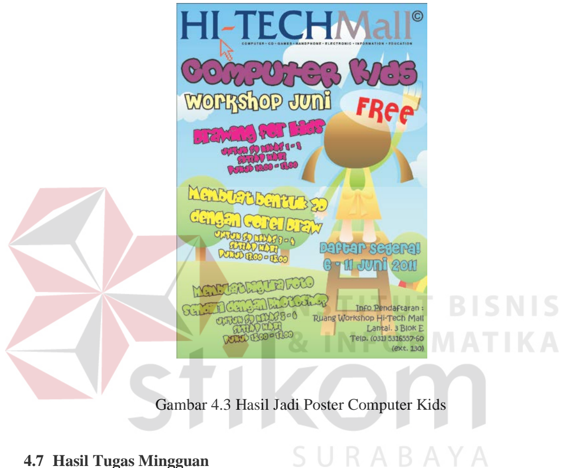
Gambar 4.3 Hasil Jadi Poster Computer Kids

Draw X4. Proses ini memakan waktu 1 hari pengerjaan dan melewati beberapa perbaikan unsur warna dan komposisi.