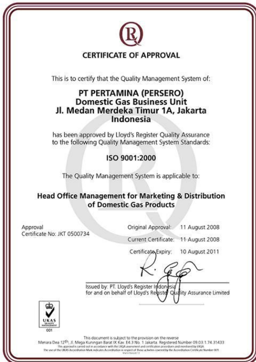
Gambar 2.3 Sertificat of Approval

Unit Gas Domestik PT. Pertamina berkomitmen untuk selalu memberikan produk dan layanan terbaik. Komitmen kami buktikan dengan memperoleh standar internasional Sistem Manajemen Kualitas, ISO 9001:2000.