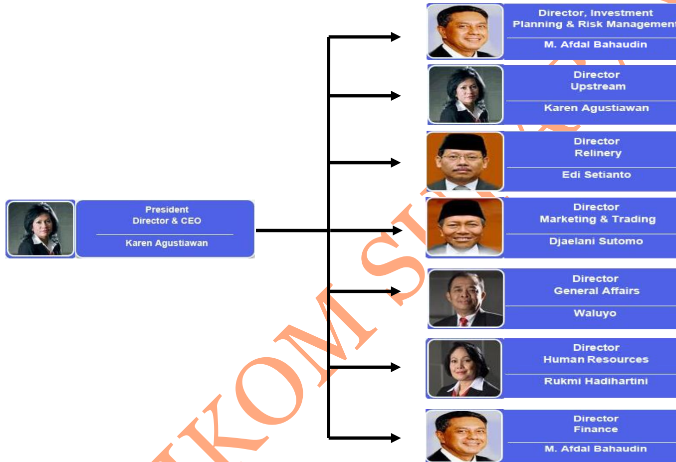
Gambar 2.1 Bagan Organisasi Perusahaan PT. Pertamina (Persero)