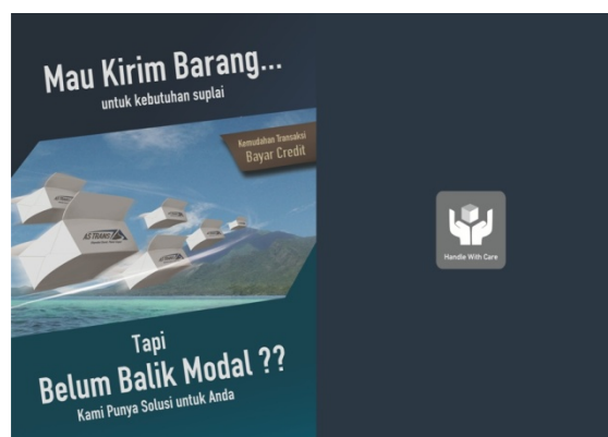
Gambar 4.7 Desain flyer Sisi luar