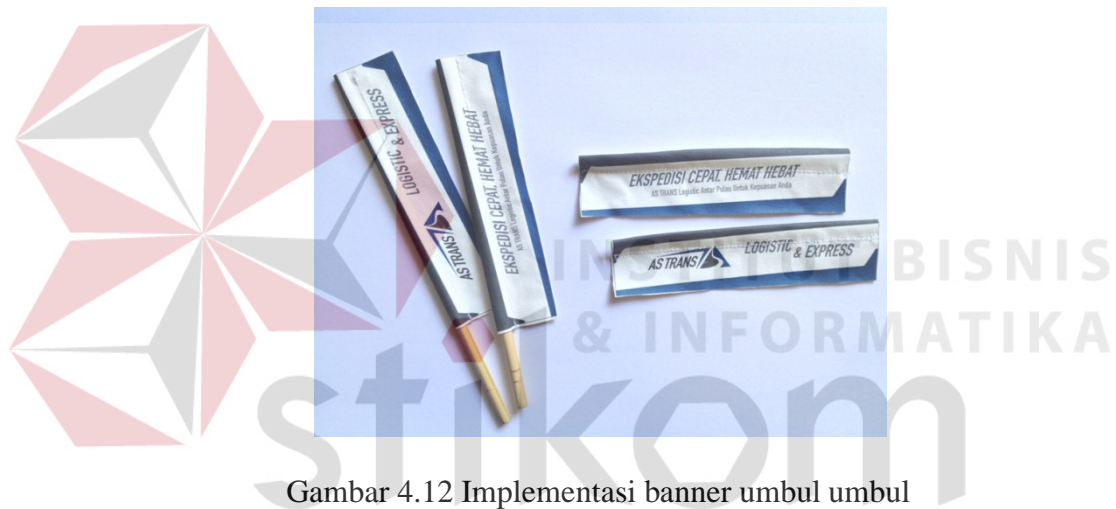
Gambar 4.12 Implementasi banner umbul umbul

Alasan pemilihan media yaitu mudah dilihat, memakan biaya yang murah peletakan yang mudah, media promosi yang cukup tahan lama. Media promosi ini sudah lama digunakan dan cukup efektif untuk pengenalan brand AS Trans. Banner ini akan diletakan dijalan – jalan raya Waru kawasan industri Kabupaten Sidoarjo dengan tujuan cukup memberi awareness pada audiens. Banner di desain dengan ukuran 1 m x 4 m, sistem cetak digital printing/flexo bahan PVC/ kain. Di Desain fokus pada pengenalan Identitas AS Trans.