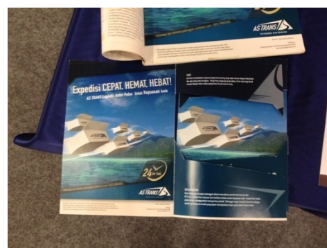
Gambar 4.9 Implementasi Desain flyer

Media Flyer memiliki umur panjang, fleksibel dan bisa dipakai tahun ke tahun, memungkinkan disebar ditempat yang berpotensi, memberikan informasi yang lebih rinci dan pesan bisa didramatisir, biaya cetak murah serta cakupan luas dan terarah karena dapat di sebar di tempat yang kita tentukan sesuai target. Flyer didesain dengan ukuran A4 (210mm x 297mm) menggunakan bahan art paper, sistem cetak offset full color dua sis. Desain brosurnya menggunakan bentuk yang sama seperti cirri khas logo yang telah dirancang, menggunakan teknik cutting agar lebih menarik menarik dari sisi inovasi dan kreatif promosi produk AS Trans.