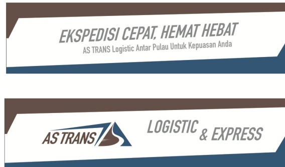
Gambar 4.12 Desain banner umbul umbul