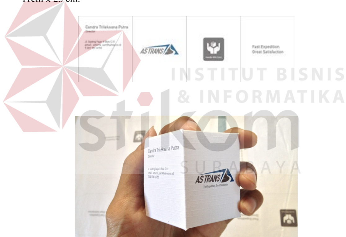
Gambar 4.13 Implementasi Gift Bussiness Card

Stationary merupakan alat branding resmi yang menghubungkan pihak perusahaan dengan relasinya. Desain dan bentuknya dirancang khusus berupa ciri khas pengiriman barang yaitu berupa box packing AS Trans, yang bisa di fungsikan sebagai souvenir tanda terimakasih kepada pelanggan. Untuk bussines card ukuran 4.5 cm x 2,2cm, 4 sisi papercraft , bahan linen 210 gsm. Kop surat di desain ukuran kertas A4 80gsm sedangkan amplop surat di desain dengan ukuran 11cm x 23 cm.