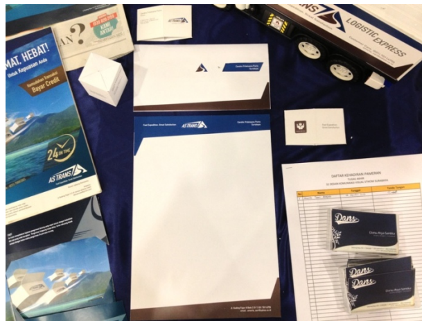
Gambar 4.14 Implementasi Stationery Set