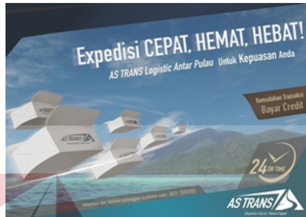
Gambar 4.2 Desain iklan Koran

menggunakan penonjolan ilustrasi box package terbang, yang melakukan pengiriman barang antar pulau yang terbang melintasi laut tanpa melakukan penyeberangan, dengan didukung headline dibagian samping ilustrasi.