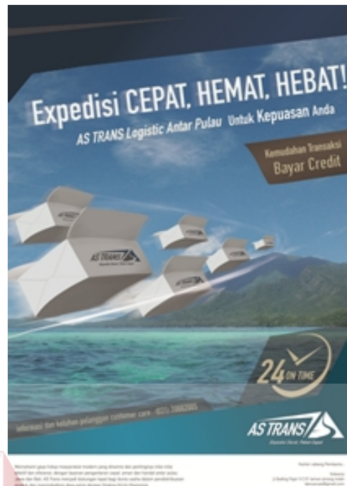
Gambar 4.4 Desain iklan Majalah