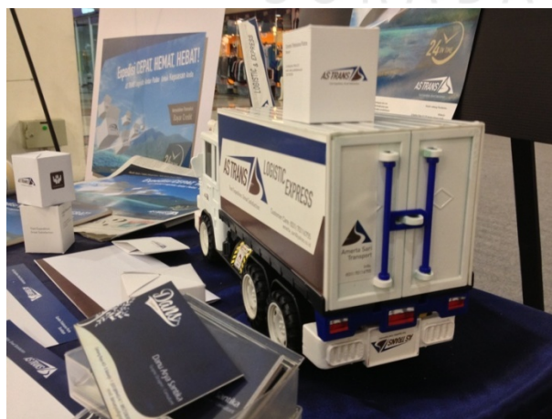
Gambar 4.11 Implementasi Mobile Branding