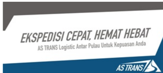
Gambar 4.6 Desain iklan Sosial media

Desain pada iklan ini ber skala kecil oleh sebab itu agar pesan headline “Cepat, Hemat Hebat” tersampaikan dan mudah dibaca maka layout di bikin white simple space. beserta subheadline-nya dan ilustrasinya. Gambar dibuat lebih interaktif dengan menggunakan slideshow gambar bergantian mulai dari keunggulan yg ditawarkan, layanan, dan nama produk jasa AS Trans agar pembaca tidak bosan. hal tersebut berdasarkan alasan kenyamanan membaca para pengunjung webite.