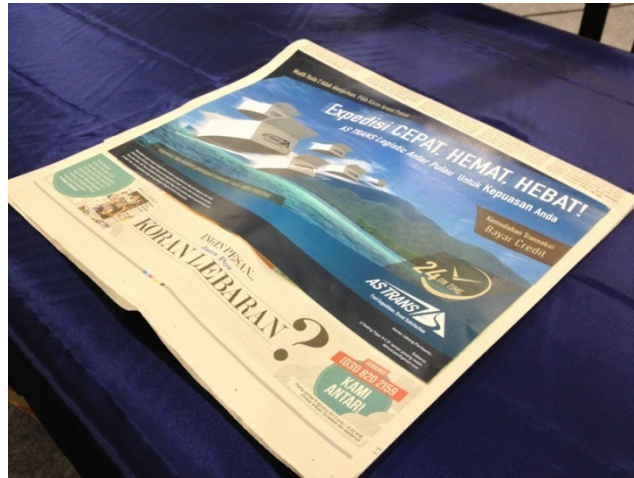
Gambar 4.3 Implementasi Desain iklan Koran