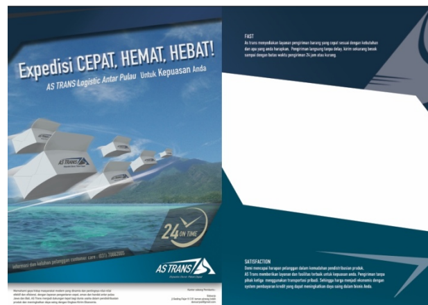
Gambar 4.8 Desain flyer Sisi Dalam

Media Flyer memiliki umur panjang, fleksibel dan bisa dipakai tahun ke tahun, memungkinkan disebar ditempat yang berpotensi, memberikan informasi yang lebih rinci dan pesan bisa didramatisir, biaya cetak murah serta cakupan luas dan terarah karena dapat di sebar di tempat yang kita tentukan sesuai target. Flyer didesain dengan ukuran A4 (210mm x 297mm) menggunakan bahan art paper, sistem cetak offset full color dua sis. Desain brosurnya menggunakan bentuk yang sama seperti cirri khas logo yang telah dirancang, menggunakan teknik cutting agar lebih menarik menarik dari sisi inovasi dan kreatif promosi produk AS Trans.