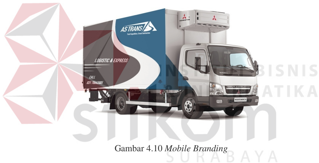
Gambar 4.10 Mobile Branding

Media ini juga sangat berpengaruh karena dapat menyentuh banyak audiens terutama para pengguna jalan sebagai efek aware ke masyarakat luas. Di saat macet pengguna jalan bisa memndapat informasi melalui logo yang di tempel pada transportasi pick up AS Trans dan pusat informasi. Stiker di tempel di bagian samping container dan belakang kontainer dengan ukuran 2 : 3 bagian box kontainer.