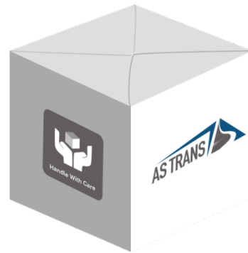
Gambar 4.15 Desain Neon Box