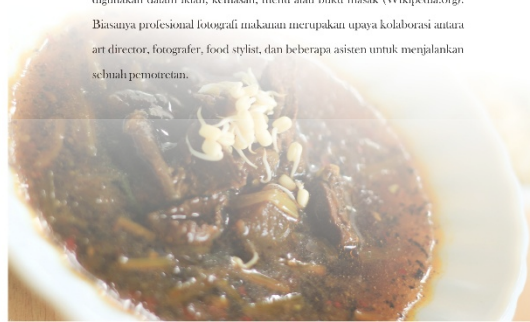
Gambar 4.3 Layout picture window

Food Photography adalah sebuah spesialisasi dari fotografi still life, bertujuan untuk menghasilkan foto-foto yang menarik dari makanan untuk digunakan dalam iklan, kemasan, menu atau buku masak (Wikipedia.org). Biasanya profesional fotografi makanan merupakan upaya kolaborasi antara art director, fotografer, food stylist, dan beberapa asisten untuk menjalankan sebuah pemotretan.