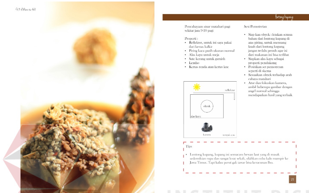
Gambar 4.2 Layout Halaman

Layout ini menggunakan Mondrian yaitu penyajian layout yang mengacu pada bentuk- bentuk square/landscape/portait, dimana masing-masing bidangnya sejajar dengan bidang penyajian dan memuat gambar/copy yang saling berpadu sehingga membentuk suatu komposisi yang konseptual. Jenis layout ini membantu dalam mengatur komposisi foto yang memiliki informasi gambar ada di kiri serta informasi dan skema foto ada di kanan.