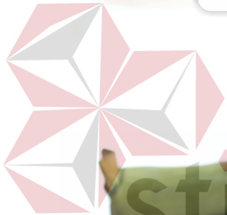
Gambar 4.5 Layout konten