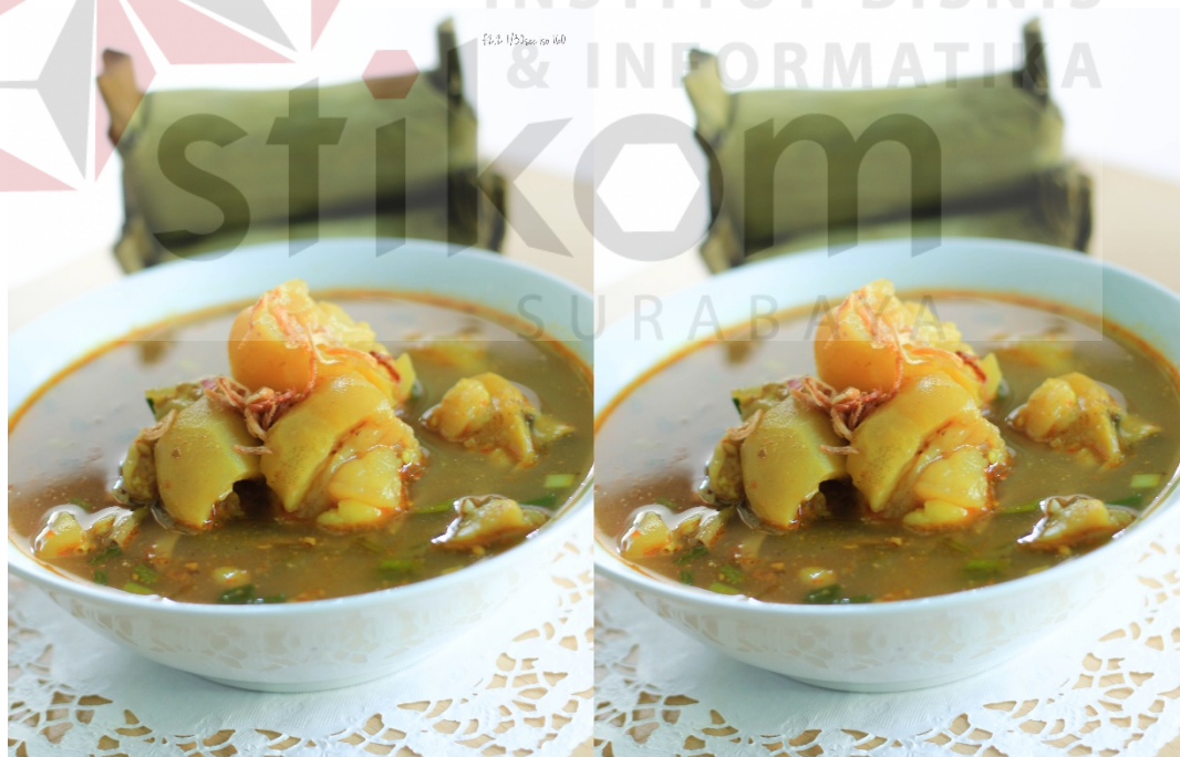
Gambar 4.6 Layout foto kikil

Karena konsep yang diusung mengarah ke Clean sehingga foto yang di preview