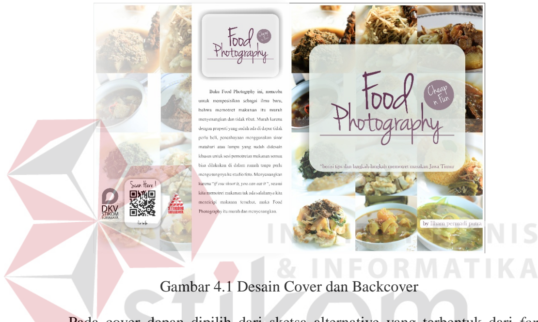
Gambar 4.1 Desain Cover dan Backcover

Pada cover depan dipilih dari sketsa alternative yang terbentuk dari forum discussion kepada masyarakat awam dan mahasiswa desain komunikasi visual STIKOM Surabaya. Pemilihan font menggunakan font script handwriting yang luwes bertuliskan Food Photography dengan sub headline Cheap n fun dan dengan body copy “berisi tips dan langkah-langkah memotret makanan Jawa Timur”. Ilustrasi menggunakan foto makanan Jawa Timur yang ditata membentuk kotak-kotak persegi sebagai backgroundnya.