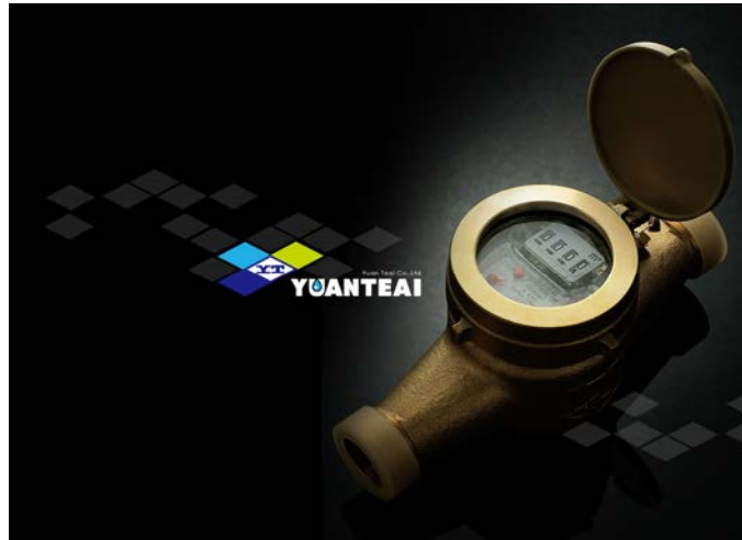
Gambar 2.1 Gambar Produksi