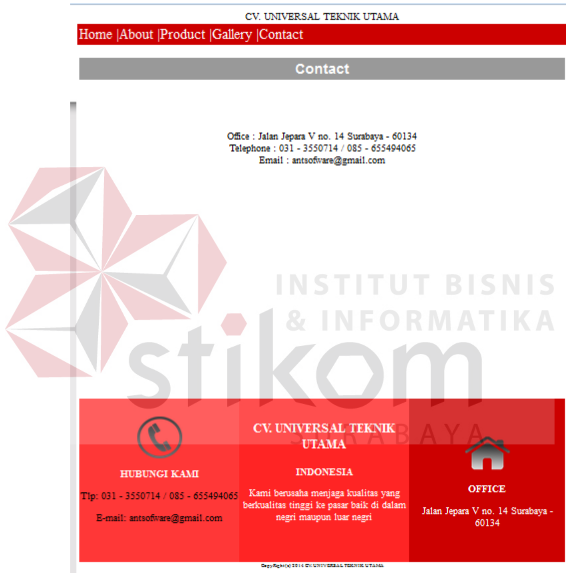
Gambar 4.4 Screen Shot Web - Contact

Halaman yang menampilkan alamat dan tempat untuk membeli produk