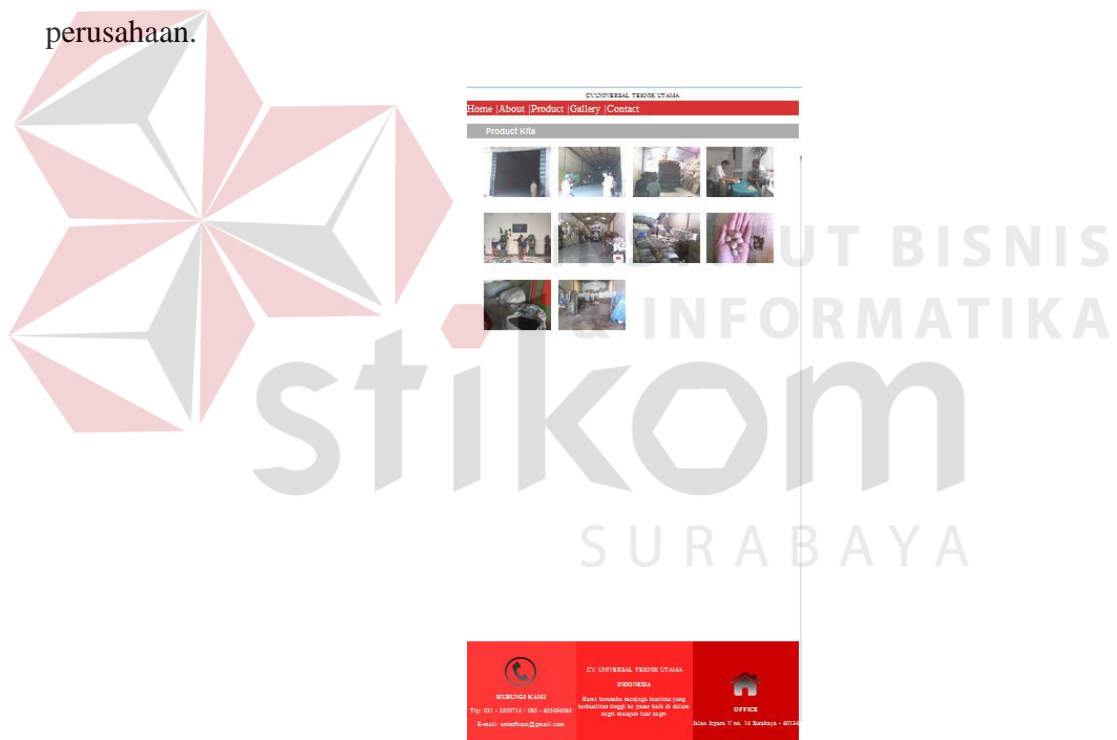
Gambar 4.3 Screen Shot Web - Gallery

Halaman yang berisi tentang penjelasan kegiatan yang ada di ruang lingkup perusahaan.