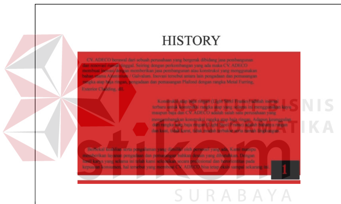
Gambar 5.4 Tampilan Halaman Sejarah

Berdasarkan konsep desain yang telah ditetapkan sebelumnya maka isi pada halaman pertama pada desain companya profile sebagai berikut :