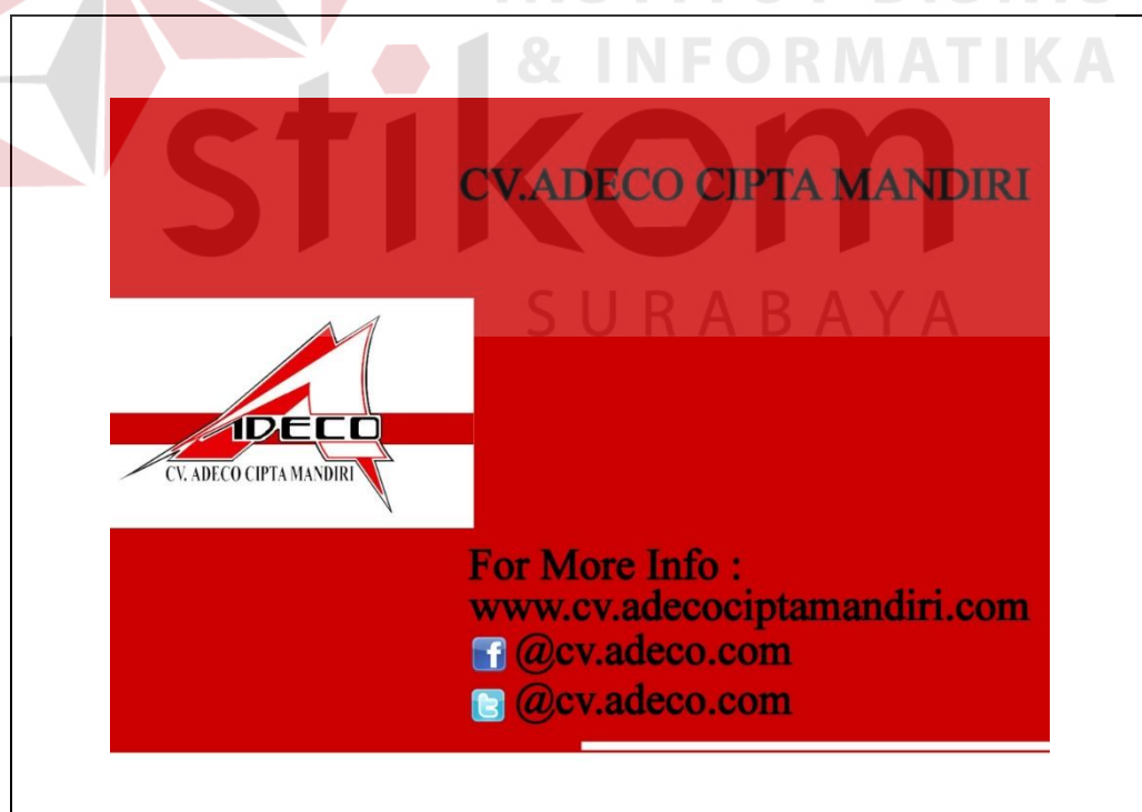
Gambar 5.2 Tampilan Halaman Pembuka

Berdasarkan konsep desain yang telah ditetapkan sebelumnya maka halaman desain pembuka company profile sebagai berikut :