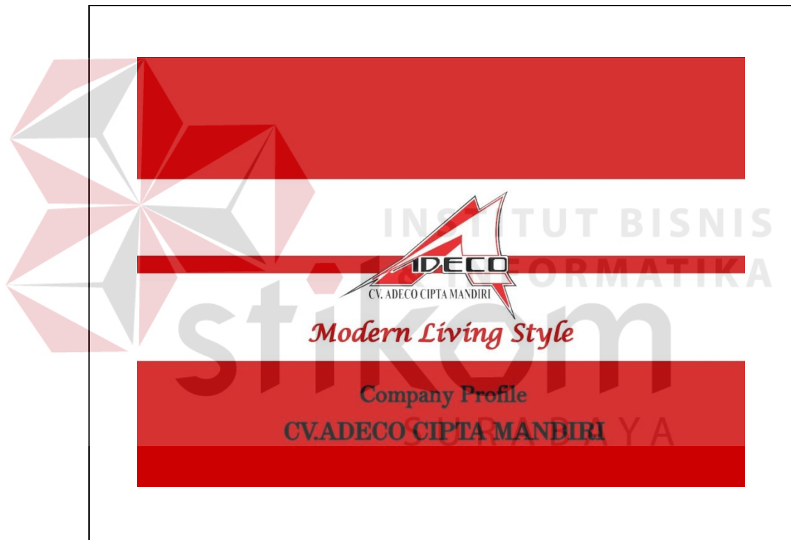
Gambar 5.1 Tampilan Cover Depan

Berdasarkan konsep desain yang telah ditetapkan sebelumnya maka cover desain companya profile sebagai berikut :