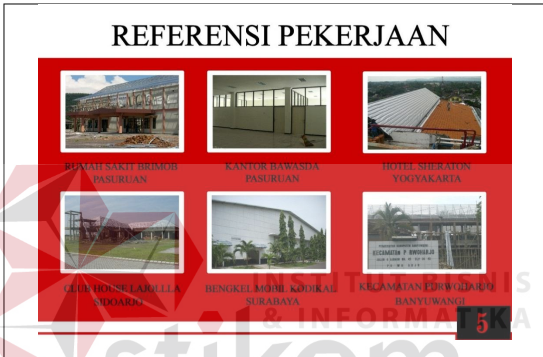
Gambar 5.8 Tampilan Halaman Referensi Pekerjaan

Berdasarkan konsep desain yang telah ditetapkan sebelumnya maka potofolio companya profile CV.Adeco Cipta Mandiri sebagai berikut :