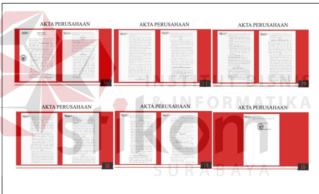
Gambar 5.13 Tampilan Halaman Akta Perusahaan