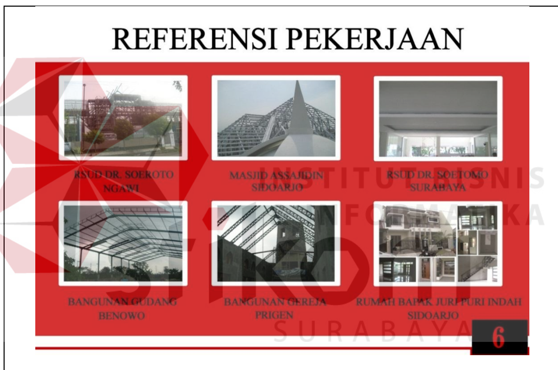
Gambar 5.9 Tampilan Halaman Referensi Pekerjaan

Berdasarkan konsep desain yang telah ditetapkan sebelumnya maka potofolio companya profile CV.Adeco Cipta Mandiri sebagai berikut :