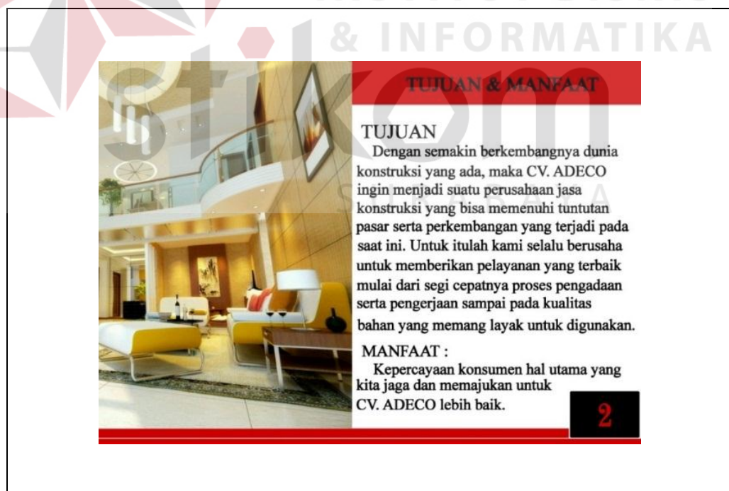
Gambar 5.5 Tampilan HalamanPortfolio

Berdasarkan konsep desain yang telah ditetapkan sebelumnya maka isi pada halaman kedua pada desain companya profile sebagai berikut :