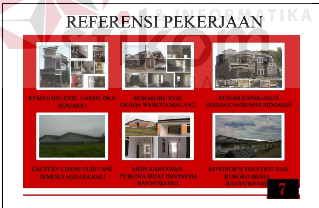
Gambar 5.10 Tampilan Halaman Referensi Pekerjaan

Berdasarkan konsep desain yang telah ditetapkan sebelumnya maka potofolio companya profile CV.Adeco Cipta Mandiri sebagai berikut :