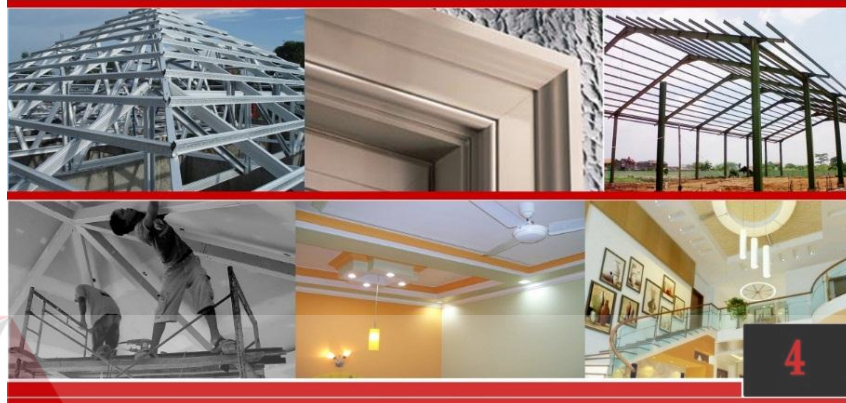
Gambar 5.7 Tampilan Halaman Alamat dan Pekerjaan

Ruko Citra Cemerlang Residence blok A / 6 C Jl. Ngampelsari, Candi - Sidoarjo Telp : 031-8054101 Fax : 031-8054101 Email : aries_adeco@yahoo.com