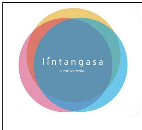
Gambar 4.1 Logo Lintangasa Creativemedia