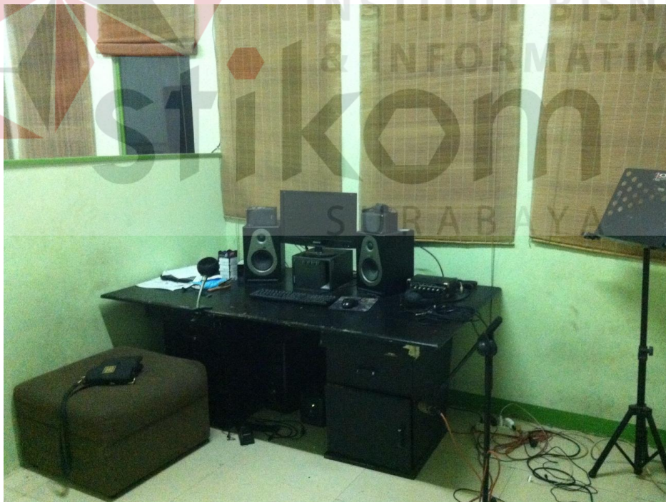
Gambar 4.6 Ruang Audio