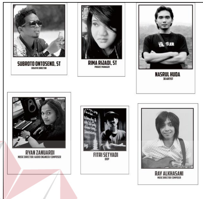
Gambar 4.3 Tim