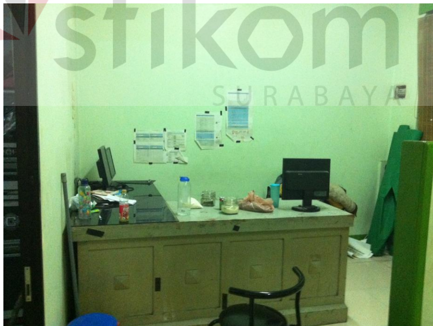
Gambar 4.4 Foto Ruang Editing Lintangasa Creativemedia