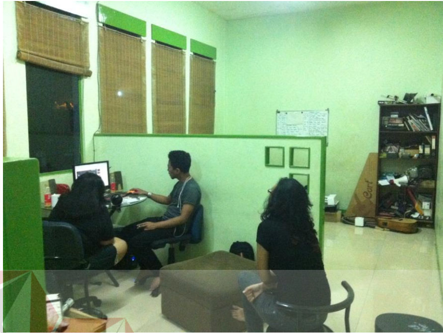
Gambar 4.5 Foto Ruang Konsep, Meja Project Manager