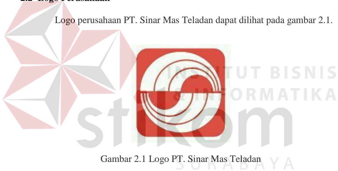
Gambar 2.1 Logo PT. Sinar Mas Teladan

Logo perusahaan PT. Sinar Mas Teladan dapat dilihat pada gambar 2.1.