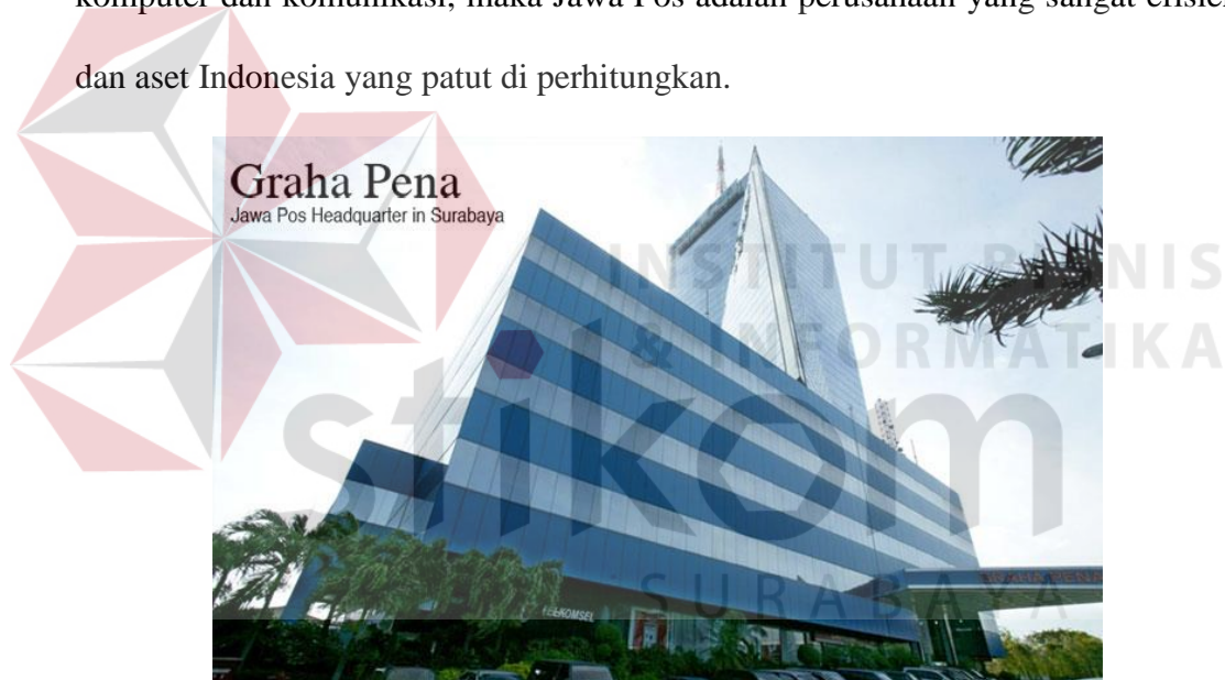
Gambar 2.1 Gedung Utama Graha Pena

Dahlan Iskan. Pada Tahun 1985, tiras Jawa Pos sudah mencapai 150.000 eksemplar/hari, hal ini karena suksesnya meliput kejatuhan presiden Marcos di Filipina. Jawa Pos kemudian berkembang cepat sekali tirasnya hingga sekarang mencapai 350.000 eksemplar/hari dengan anak perusahaan sebanyak 90 koran lebih di daerah-daerah seluruh propinsi di Indonesia. Jawa Pos sekarang sudah menjadi salah satu kelompok industri media terbesar di Indonesia, dengan sumber daya karyawan sekitar 400 orang lebih dari berbagai disiplin ilmu serta mendirikan pabrik kertas koran dan percetakan 2 di daerah-daerah dengan dukungan teknologi komputer dan komunikasi, maka Jawa Pos adalah perusahaan yang sangat efisien dan aset Indonesia yang patut di perhitungkan.