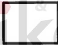
Gambar 3.4 Proses

Menunjukkan kegiatan proses dari operasi program komputer.