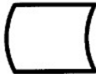
Gambar 3.5 Database

Menunjukkan tempat untuk menyimpan data hasil operasi komputer.