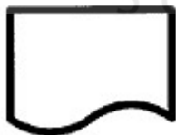
Gambar 3.1 Dokumen

Menunjukkan dokumen input dan output untuk proses manual atau komputer.