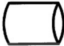
Gambar 3.3 Simpanan Offline

Menunjukkan file non -komputer yang diarsip.