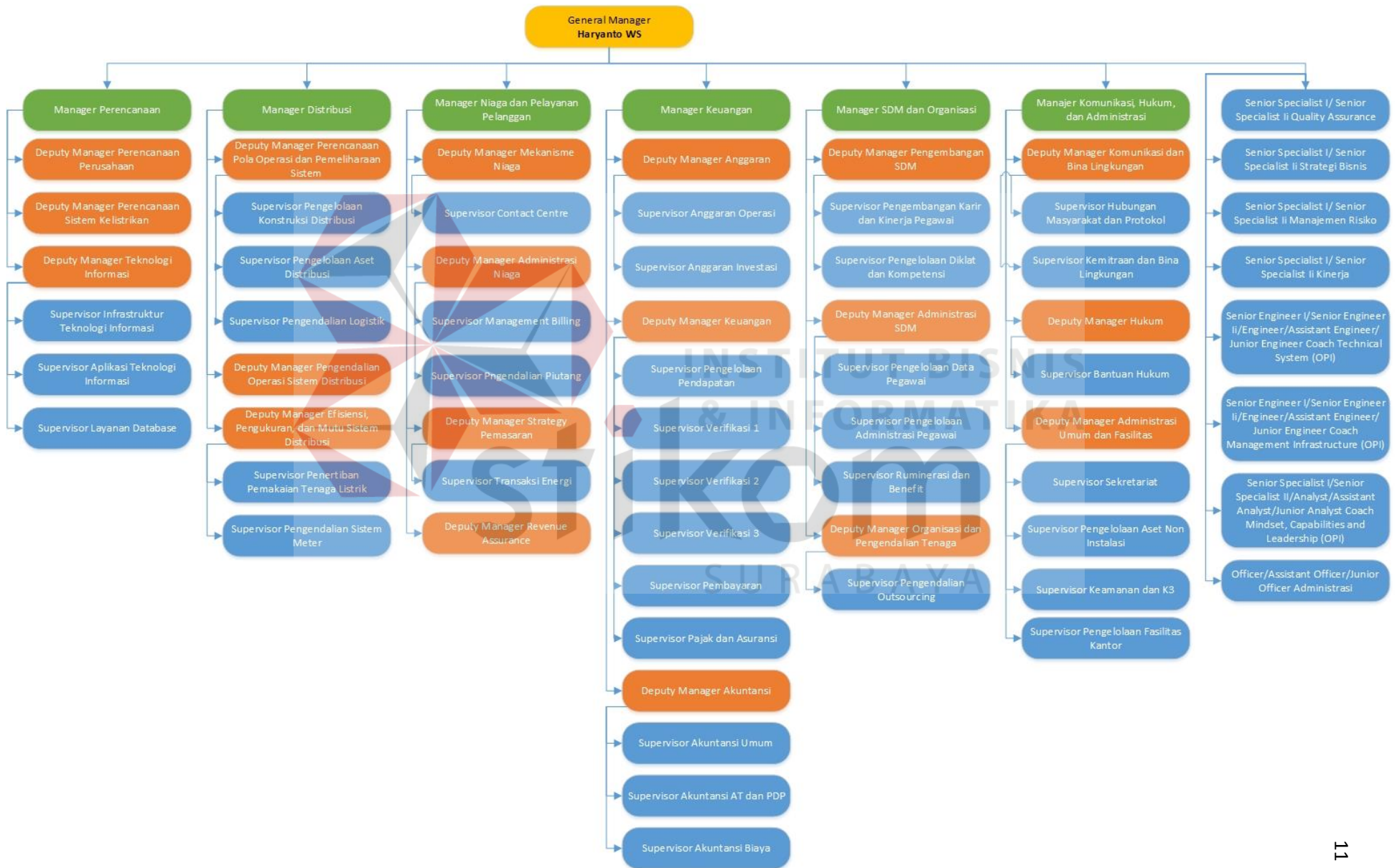
Gambar 2.1 Struktur Organisasi PT PLN (Persero) Distribusi Jawa Timur