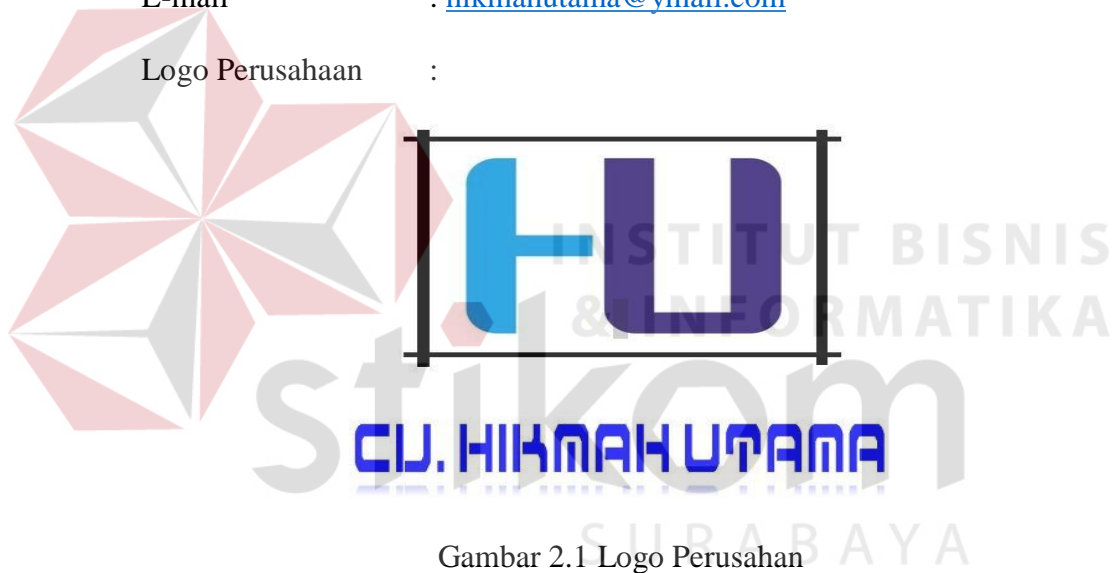
Gambar 2.1 Logo Perusahaan

Nama Perusahaan : CV. Hikmah Utama Alamat Pendirian : Wisma Kedung Asem Indah Blok i-15, Surabaya Alamat Operasional : Jl. Raya Kedung Asem No. 93, Surabaya. Phone : 031-8711464 Fax : 031-8711464 Mobile : 085731009636, 031-92261231 E-mail : hikmahutama@gmail.com Logo Perusahaan :