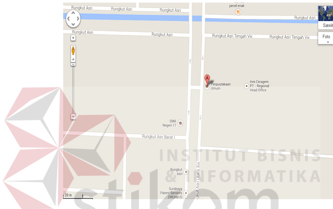
Gambar 2.1 Lokasi Perusahaan

Badan Arsip dan Perpustakaan Kota Surabaya berlokasi di Jalan Rungkut Asri Tengah 5-7 Surabaya Timur. Untuk lebih detailnya peta alamat perusahaan ini dapat dilihat dari gambar 2.1 dibawah ini.