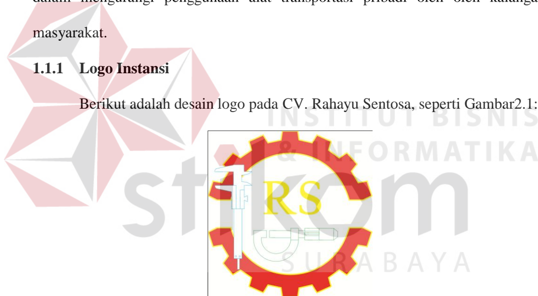
Gambar 2.1 Logo CV. Rahayu Sentosa

Berikut adalah desain logo pada CV. Rahayu Sentosa, seperti Gambar 2.1: