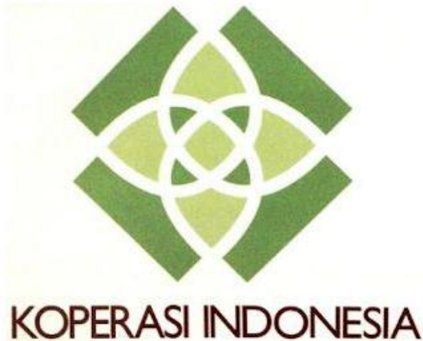
Gambar 2. Logo Koperasi Indonesia

Koperasi Wanita Anugerah Bersama termasuk dalam ikatan Koperasi Indonesia, untuk itu semua prosedur untuk aktifitas koperasi menggunakan standar dari Koperasi Indonesia. Adapun logo yang dipakai oleh Koperasi Wanita Anugerah Bersama merupakan logo Koperasi Indonesia yang tergambar pada Gambar 2 di atas. Sesuai dengan Peraturan Menteri Koperasi dan UKM Nomor 02/Per/M.KUKM/IV/2012 yang diterbitkan pada tanggal 17 April 2012 tentang Penggunaan Lambang Koperasi Indonesia adalah gambar bunga mengandung makna Koperasi Indonesia yang selalu berkembang, cermelang, berwawasan, variatif, inovatif sekaligus produktif dalam kegiatannya, serta berwawasan dan berorientasi pada keunggulan dan teknologi. Dominasi warna hijau pastel pada logo Koperasi Indonesia memiliki kesan berwibawah dan kalem.