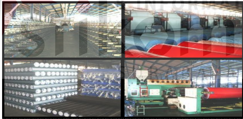
Gambar 2.2 Mesin Produksi

Di bawah ini adalah gambar mesin Produksi yang di gunakan oleh PT. Gita pacific untuk memproduksi terpal dengan kualitas yang bagus.