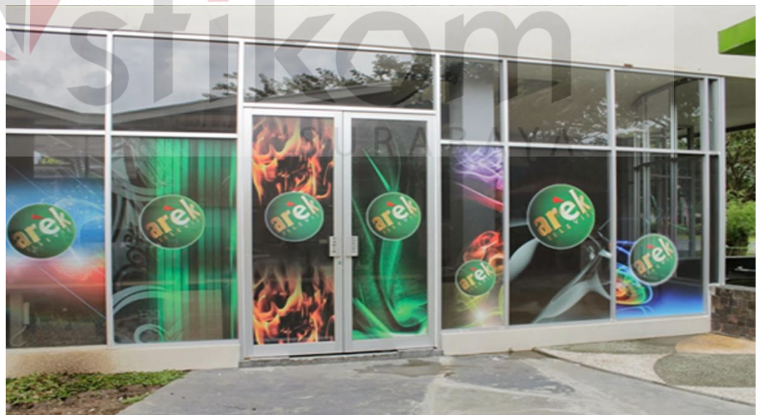
Gambar 4.3 : Foto Studio PT. AREK TV dan MCR

Kahuripan Nirwana Village, Sidoarjo, Jawa Timur