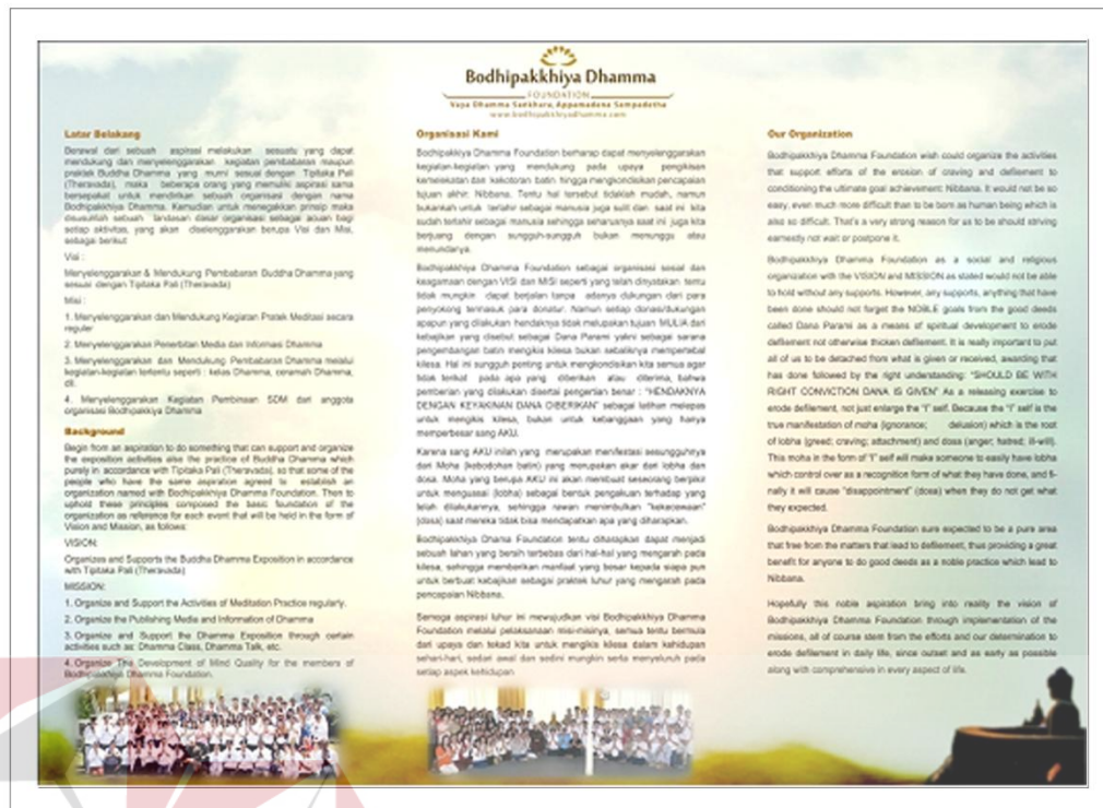
Gambar 5.7 : Alternative Brochure Halaman Dalam Bodhipakkhiya Dhamma

Alternatif brosur ini adalah sebagai cadangan agar klien dapat memilih brosur mana yang lebih layak dipilih. Brosur ini menggunakan ukuran A4 ( landscape ) karena akan dilipat menjadi tiga bagian. Desain halaman dalam brosur ini menggunakan ilustrasi awan agar para audience yang melihat brosur ini merasa tenang, nyaman, damai, serta mengikuti ilustrasi halaman luar brosur, ilustrasi sang budha karena Bodhipakkhiya Dhamma merupakan organisasi yang bersifat keagamaan, serta sedikit cuplikan foto dari kegiatan Bodhipakkhiya Dhamma.