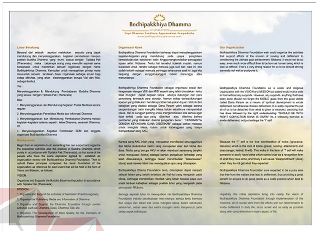
Gambar 5.5 : Brochure Halaman Dalam Bodhipakkhiya Dhamma

Brosur ini menggunakan ukuran A4 ( landscape ) karena akan dilipat menjadi tiga bagian. Desain halaman dalam brosur ini menggunakan ilustrasi alam agar para audience yang melihat brosur ini merasa tenang dan damai yang merupakan konsep dari logo Bodhipakkhiya Dhamma.