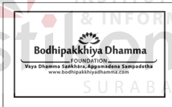
Gambar 5.1 : Stempel Warna Negatif Bodhipakkhiya Dhamma

Stempel ini dibuat dengan ukuran stempel (3,5x2 cm) dengan warna negatif atau hitam putih, karena warna tersebut merupakan warna dasar sebelum pencarian warna selanjutnya. Dan terdapat Logo Bodhipakkhiya Dhamma yang melambangkan kesederhanaan.