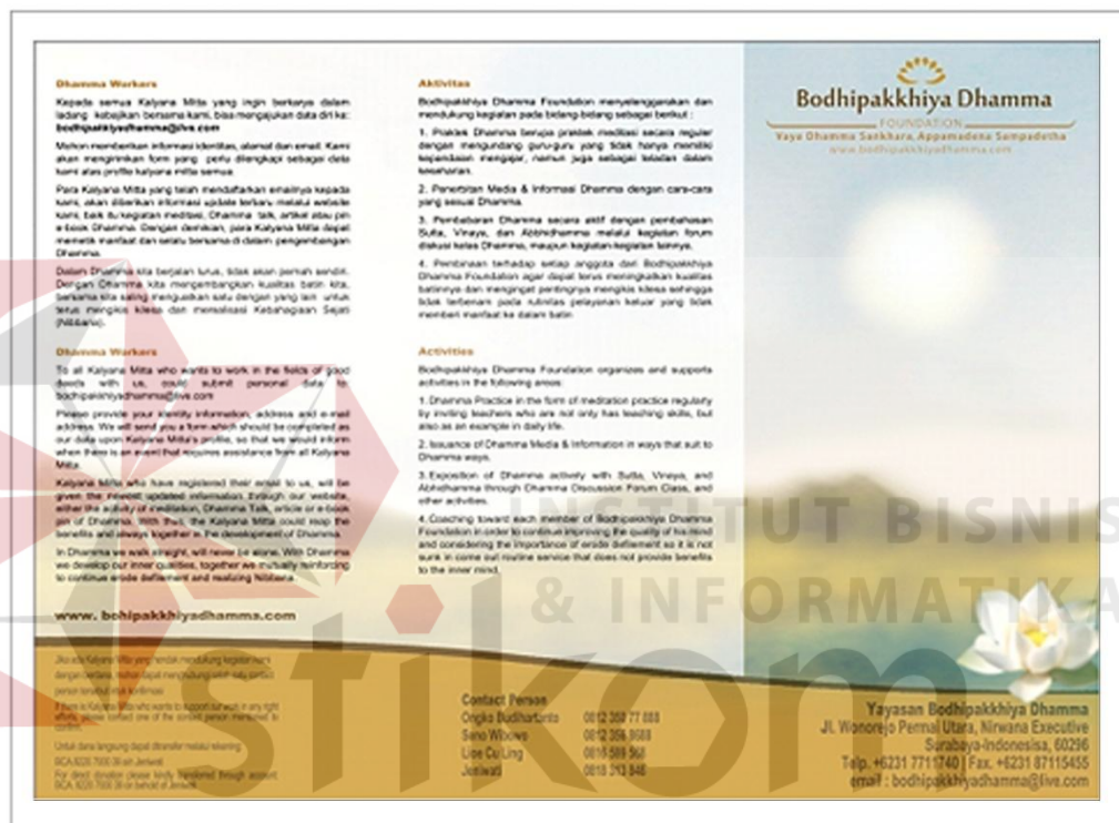
Gambar 5.4 : Brochure Halaman Luar Bodhipakkhiya Dhamma

Brosur ini menggunakan ukuran kertas A4 ( landscape ) karena akan dilipat menjadi tiga bagian. Desain halaman luar brosur ini menggunakan ilustrasi alam serta bunga teratai sebagai simbol dari logo Bodhipakkhiya Dhamma.