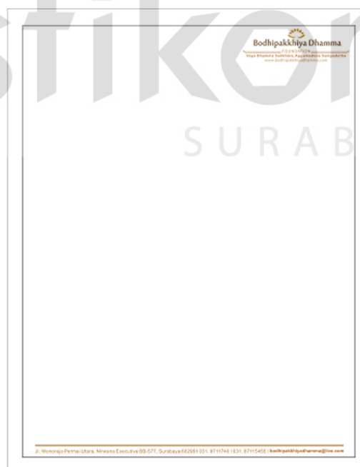
Gambar 5.3 : Kop Surat Bodhipakkhiya Dhamma