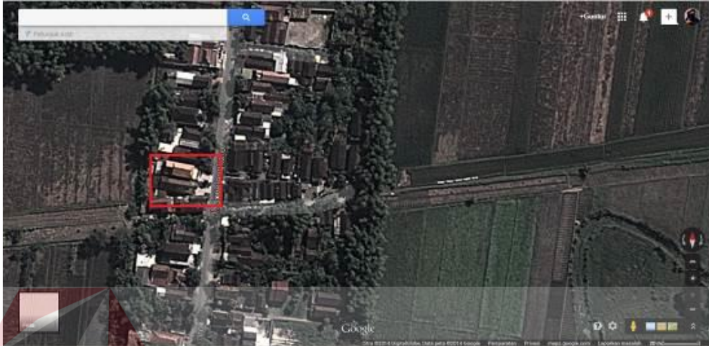
Gambar 4.2 : Lokasi Perusahaan Dilihat dari Satelit

Gambar dengan tanda kotak merah pada gambar 4.2 adalah lokasi Keyna Galeri yang diambil dari satelit Google yang berada di l. Joyo Lenggoro No.30 Ploso, Jombang