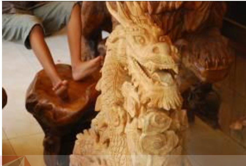
Gambar 4.8 Hasil Karya Seni Ukir Patung Keyna Galeri