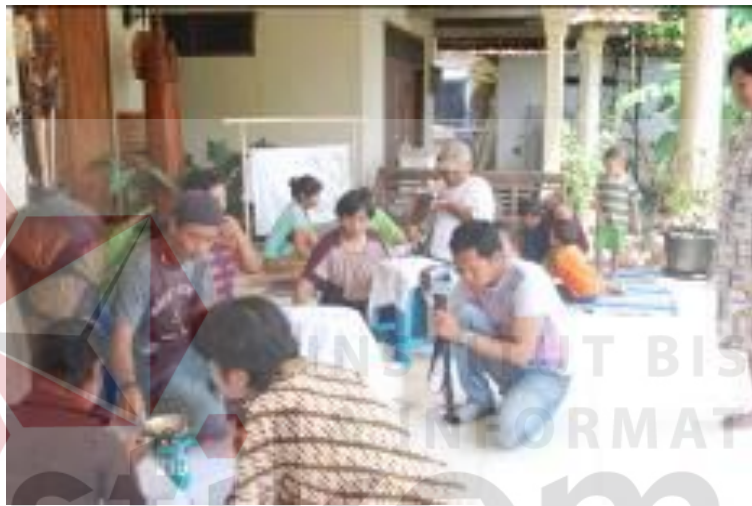
Gambar 4.6. Kegiatan Workshop Batik

Keyna Galeri tidak hanya mendisplay karya seni saja, namun membuat beberapa kegiatan sosial seperti workshop membatik yang dilakukan setiap hari sabtu di Keyna Galeri dan dimateri oleh Pemilik Keyna Galeri. Berikut gambar hasil karya dan kegiatan Keyna Galeri.