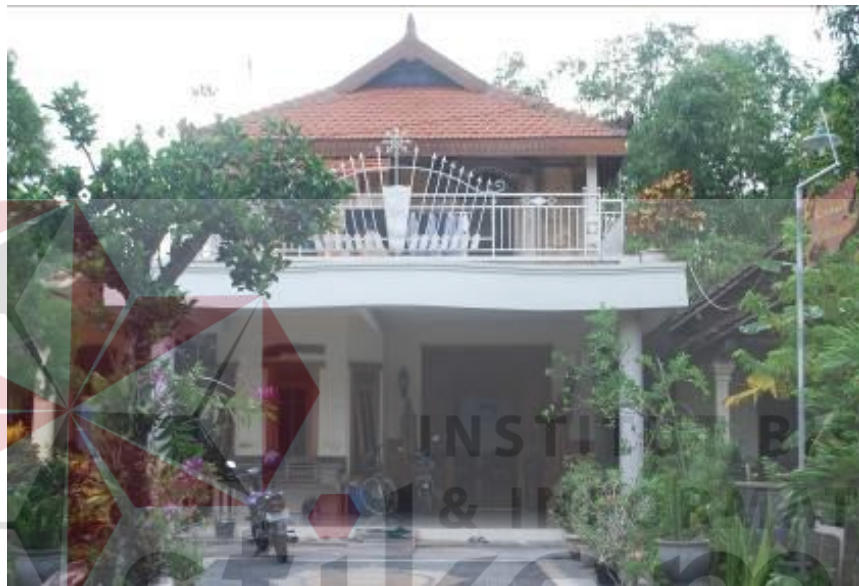
Gambar 4.4 Foto tampak depan Keyna Galeri

Berikut ini adalah kondisi ruangan Keyna Galeri. Keyna Galeri berada pada lantai 2 rumah bapak Karsam., MA.,Ph.D. Berikut foto hasil dokumentasi penulis tentang keadaan ruang Keyna Galeri.