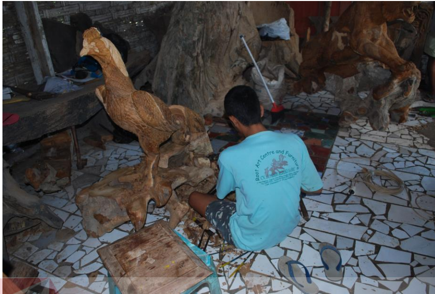
Gambar 4.10 Hasil Karya Patung Keyna Galeri