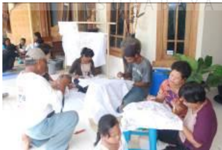
Gambar 4.7 Kegiatan Workshop Membatik Keyna Galeri