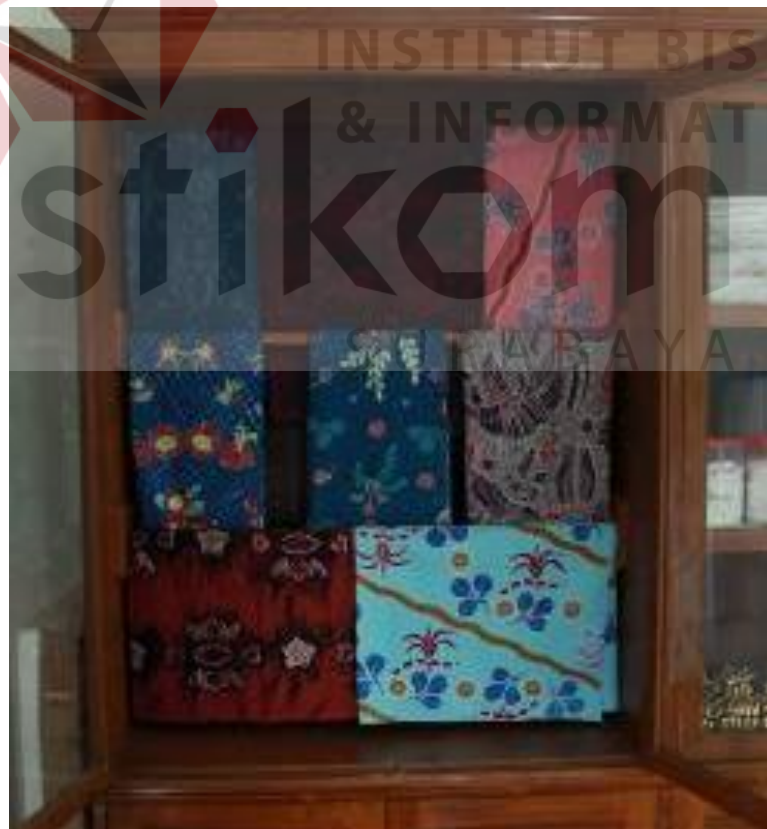
Gambar 4.9 Hasil Karya Keyna Galeri