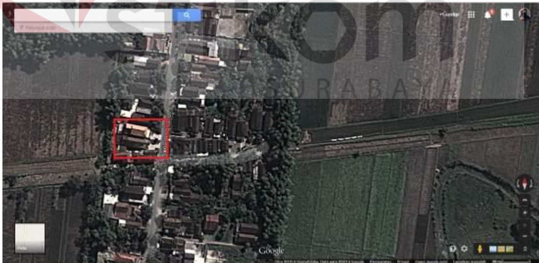
Gambar 4.2 Lokasi Perusahaan Dilihat dari Satelit