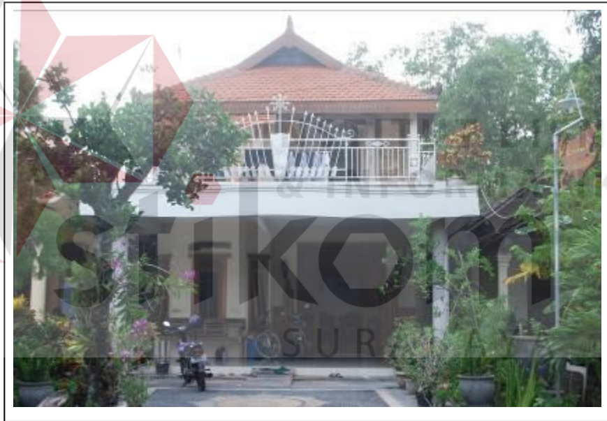
Gambar 4.3 Foto tampak depan Keyna Galeri

Berikut ini adalah kondisi ruangan Keyna Galeri. Keyna Galeri berada pada lantai 2 rumah bapak Karsam., MA.,Ph.D. Berikut foto hasil dokumentasi penulis tentang keadaan ruang Keyna Galeri.