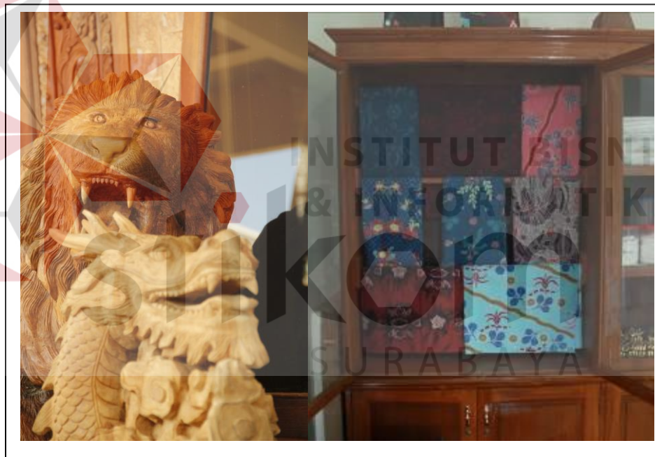
Gambar 4.6 Hasil Karya Keyna Galeri