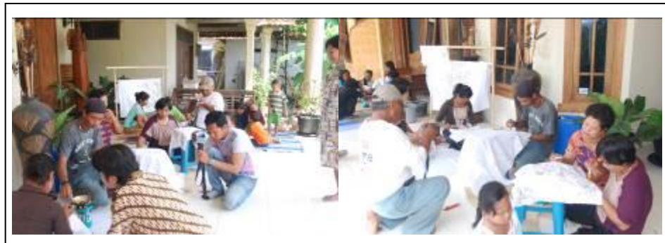
Gambar 4.5 Kegiatan Workshop Membuat Keyna Galeri