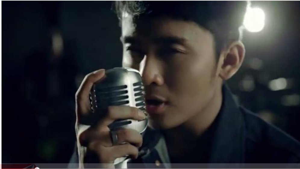
Gambar 4.11 MV Prinz "CTPM (Cinta Tak Pernah Mati)"