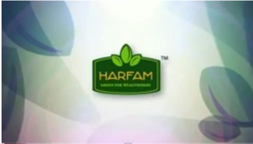
Gambar 4.7 Harfam Green For Wealthiness (Sumber: www.youtube.com/user/ontoseno50/videos )