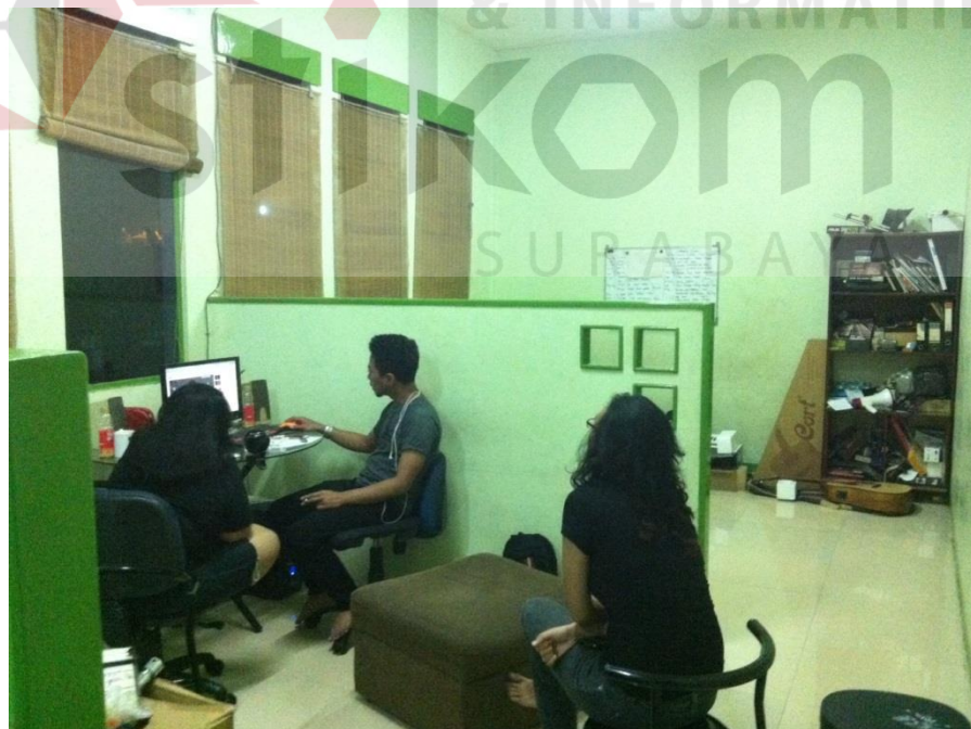
Gambar 4.3 Ruang Konsep di CV. Lintangasa Creativemedia