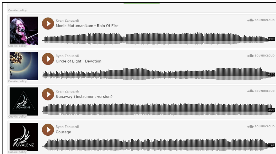
Gambar 4.5 Produk Audio CV. Lintangasa Creativemedia