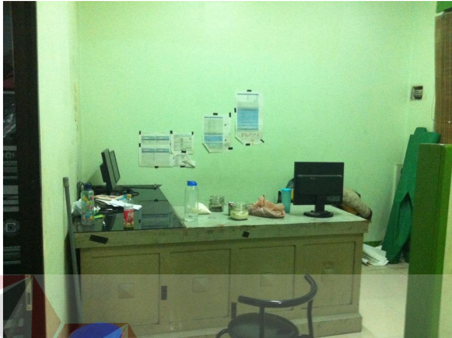
Gambar 4.2 Ruang Editing CV. Lintangasa Creative Media