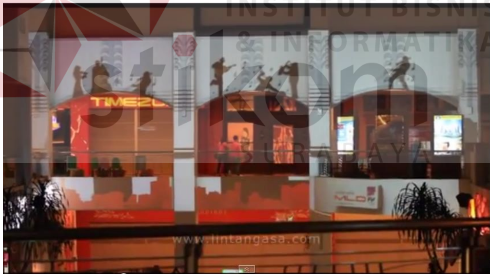
Gambar 4.10 Visual 3D Mapping Java Jazz Festival At Surabaya Town Square (Sumber: www.youtube.com/user/ontoseno50/videos )