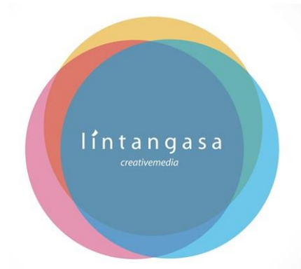
Gambar 4.1 Logo Perusahaan CV. Lintangasa Creativemedia