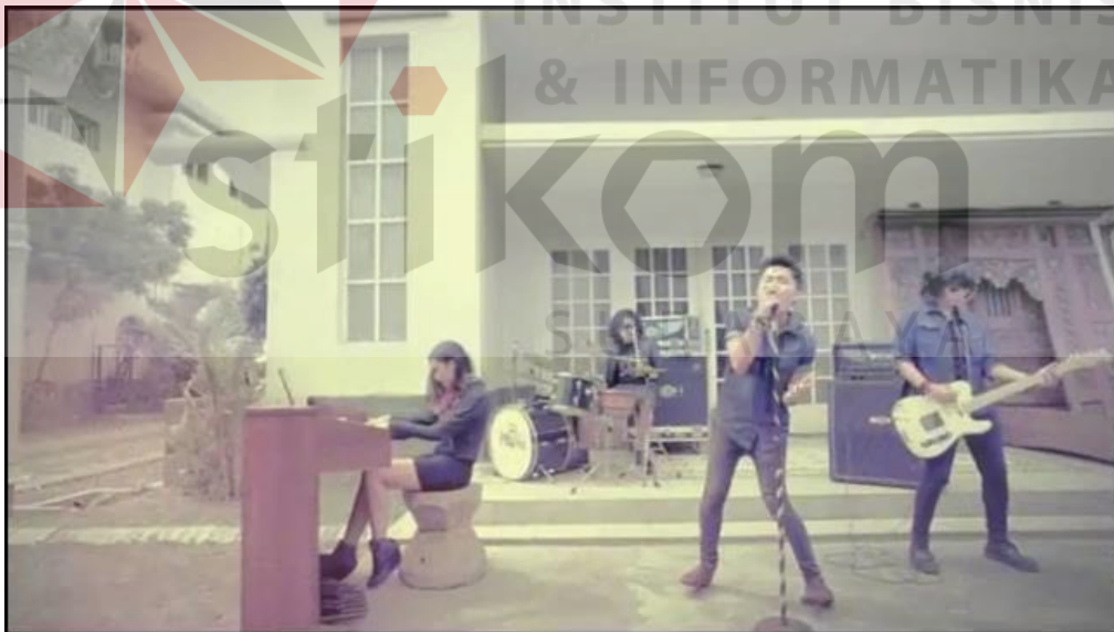
Gambar 4.12 MV Prinz Band Single "Entah Mengapa"