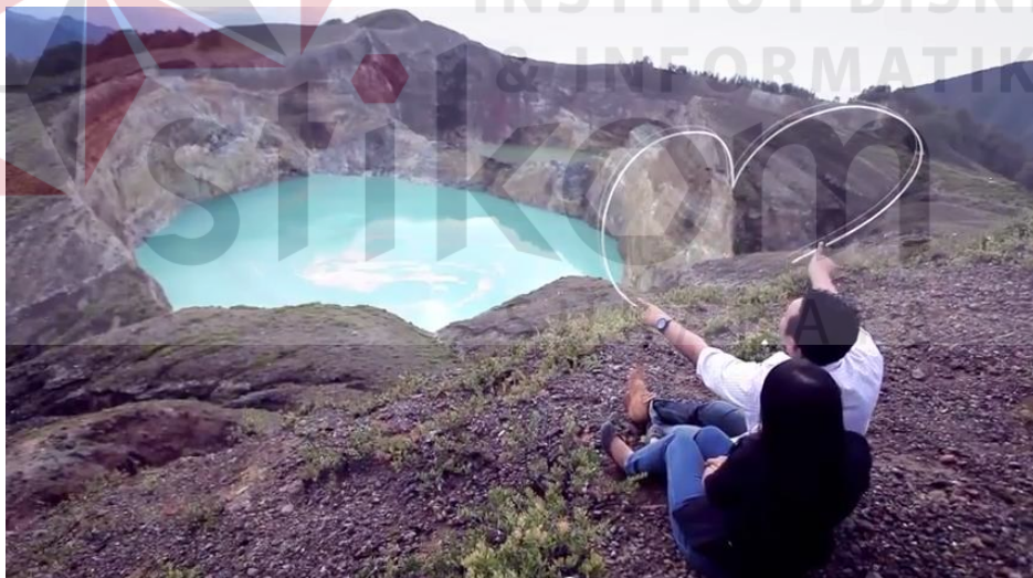
Gambar 4.6 Wahyu and Mita "Another Love Story from the Magical Island"