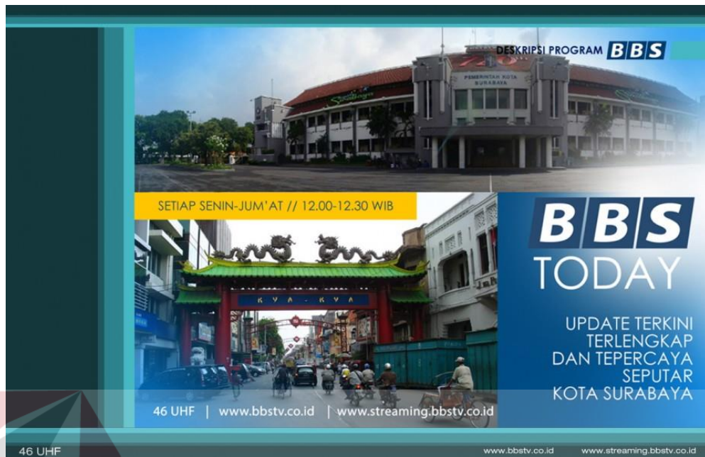
Gambar 4.12 Program news BBS TODAY BBS TV Surabaya

Program News yang berjudul BBS TODAY, ini adalah program yang menayangkan berbagai rangkaian update-an berita terkini, terlengkap, dan terpercaya seputar kota Surabaya, program ini ditayangkan di BBS TV setiap hari senin hingga jum'at, ditayangkan selama 30 menit yakni mulai pukul 12.00-12.30 WIB.