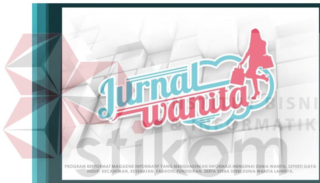
Gambar 4.7 Program entertainment Jurnal Wanita BBS TV Surabaya

Gambar 4.6 adalah Program entertainment yang berjudul Smart Mom, ini adalah program Talk Show informative yang mengangkat informasi tentang kesehatan, pendidikan dan psikologi anak, tiap episode dalam program acara Smart mom ini mengangkat tema parenting, menghadirkan bunda atau ibu-ibu yang punya pengalaman serupa dengan tema, dan program acara Smart Mom ini didukung oleh pakar yang ahli dibidangnya untuk menjelaskan sesuai tema.