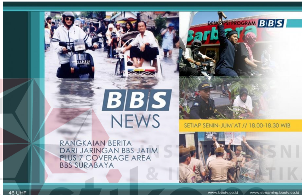
Gambar 4.10 Program news BBS NEWS BBS TV Surabaya

Gambar 4.9 adalah Program entertainment yang berjudul Diary Hijab, ini adalah program yang mengupas profil seorang wanita yang berhijab, baik dari latar belakang profesi, kuluarga, maupun kehidupan sosialnya.