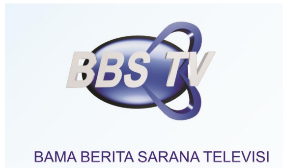
Gambar 4.1 Logo BBS TV Surabaya pada tahun 2008 (pertama)

Berikut ini adalah Logo PT. Bama Berita Sarana Televisi (BBS TV) Surabaya dari awal hingga saat ini: