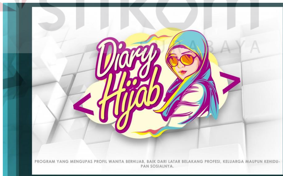
Gambar 4.9 Program entertainment Diary Hijab BBS TV Surabaya

Program entertainment yang berjudul Fashion Icon, ini adalah program yang mengupas fashion seseorang dari ujung kaki sampai ujung rambut, sekaligus memberikan tips mengenai cara berbusana.