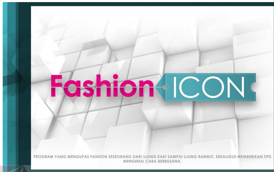
Gambar 4.8 Program entertainment Fashion Icon BBS TV Surabaya (Sumber: www.bbstv.co.id )

Program entertainment yang berjudul Fashion Icon, ini adalah program yang mengupas fashion seseorang dari ujung kaki sampai ujung rambut, sekaligus memberikan tips mengenai cara berbusana.