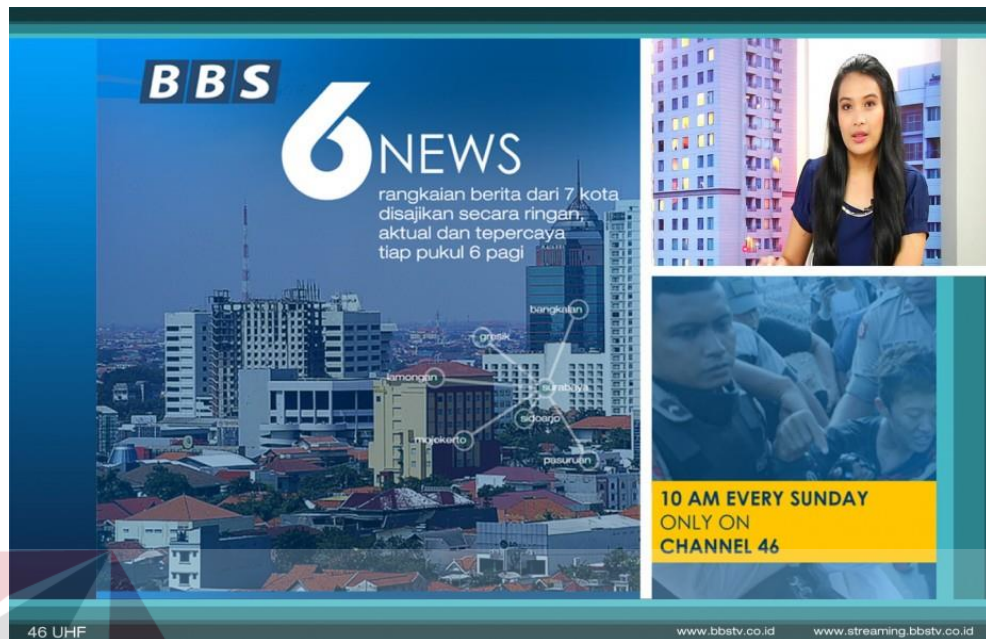
Gambar 4.13 Program news BBS 6 NEWS BBS TV Surabaya

Program News yang berjudul BBS 6 NEWS, ini adalah program yang menayangkan berbagai rangkaian update-an berita terkini dari 7 kota, disajikan secara ringan, actual dan terpercaya, program ini ditayangkan di BBS TV setiap hari senin hingga jum'at, ditayangkan selama 30 menit yakni mulai pukul 06.00 WIB.