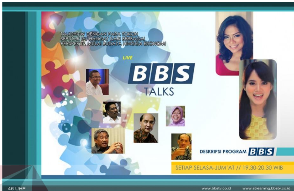
Gambar 4.11 Program news BBS TALKS BBS TV Surabaya

Program News yang berjudul BBS TALKS, ini adalah program Talkshow yang menayangkan dan menghadirkan dengan para tokoh seputar isu hangat dari berbagai perspektif, mulai dari budaya hingga ekonomi, program ini ditayangkan di BBS TV setiap hari selasa hingga jum'at, ditayangkan selama 60 menit yakni mulai pukul 19.30-20.00 WIB.