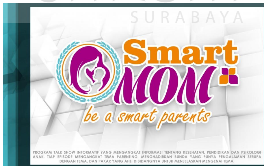
Gambar 4.6 Program entertainment Smart Mom BBS TV Surabaya

PT. Bama Berita Sarana Televisi (BBS TV) Surabaya memiliki beberapa program acara (entertainment dan News) diantaranya: