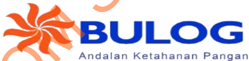
Gambar 2.1 Logo Perum Bulog