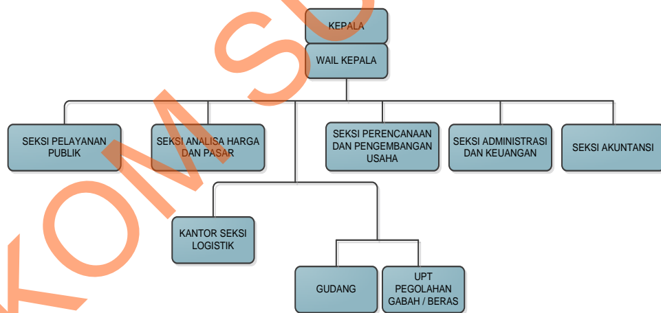
Gambar 2.4 Struktur Organisasi Perum Bulog Sub Divre Surabaya Utara