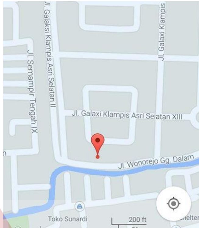
Gambar 2.2 Lokasi Rumah Tahfidz Qur'an