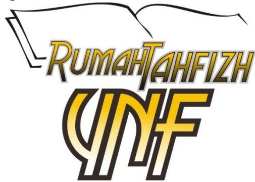
Gambar 2.1 Logo Rumah Tahfidz

Keterangan gambar logo Rumah Tahfidz Qur'an :