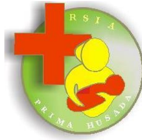
Gambar 2. 1 Logo RSIA PRIMA HUSADA

Berikut adalah desain logo pada RSIA PRIMA HUSADA, seperti Gambar 2.1 :