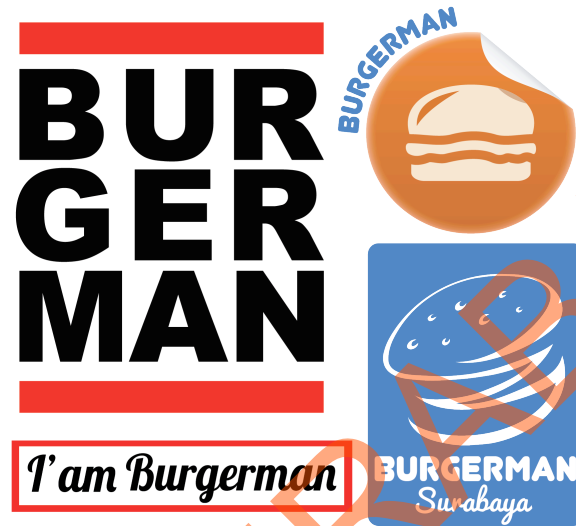
Gambar stiker 4.6

Desain stiker ini dicetak menggunakan kertas stiker vinyl