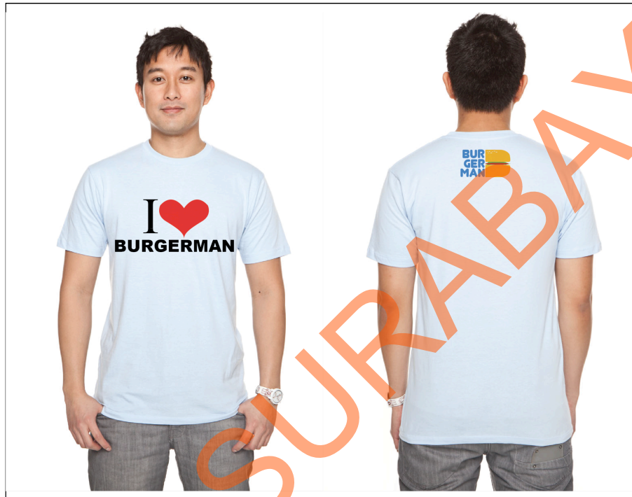
Gambar kaos 4.5

Desain kaos ini dijadikan sebagai merchandise dan diproduksi dengan berbagai ukuran ( S, M, L, XL )