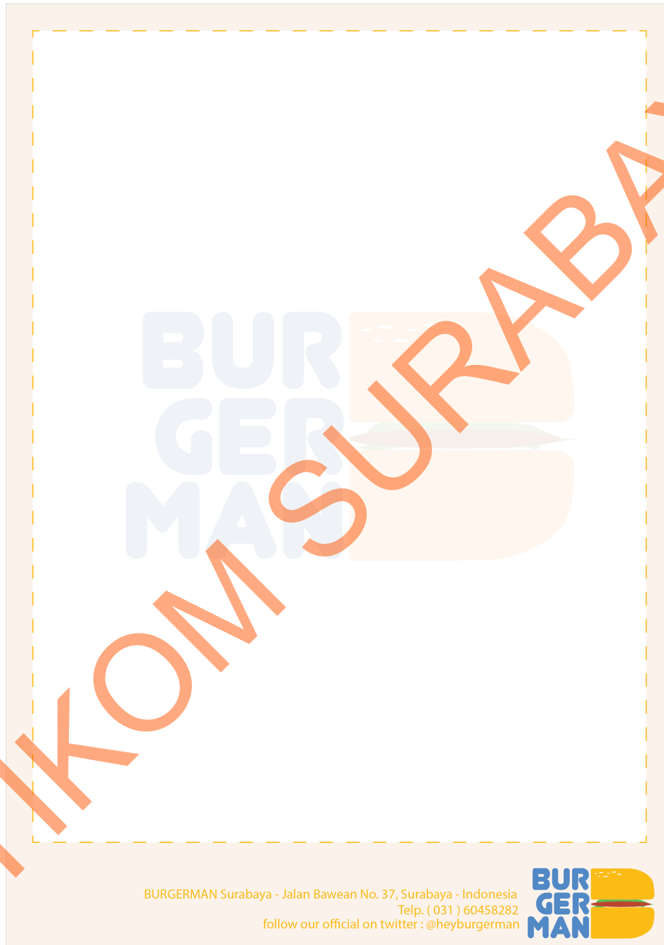
Gambar kop surat 4.2

Desain kop surat ini dicetak dengan ukuran A4 (21x29,7 cm), dan digunakan untuk menulis surat penting ke perusahaan lain.