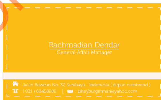
Gambar kartu nama 4.1

Desain kartu nama ini dicetak dengan ukuran 5,5x9 centimeter. Desain kartu nama terdiri dari tampak depan dan belakang.