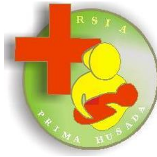
Gambar 2.1 Logo RSIA PRIMA HUSADA

Berikut adalah desain logo pada RSIA PRIMA HUSADA, seperti Gambar 2.1: