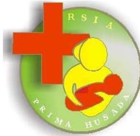
Gambar 2. 1 Logo RSIA PRIMA HUSADA

Berikut adalah desain logo pada RSIA PRIMA HUSADA, seperti Gambar 2.1 :