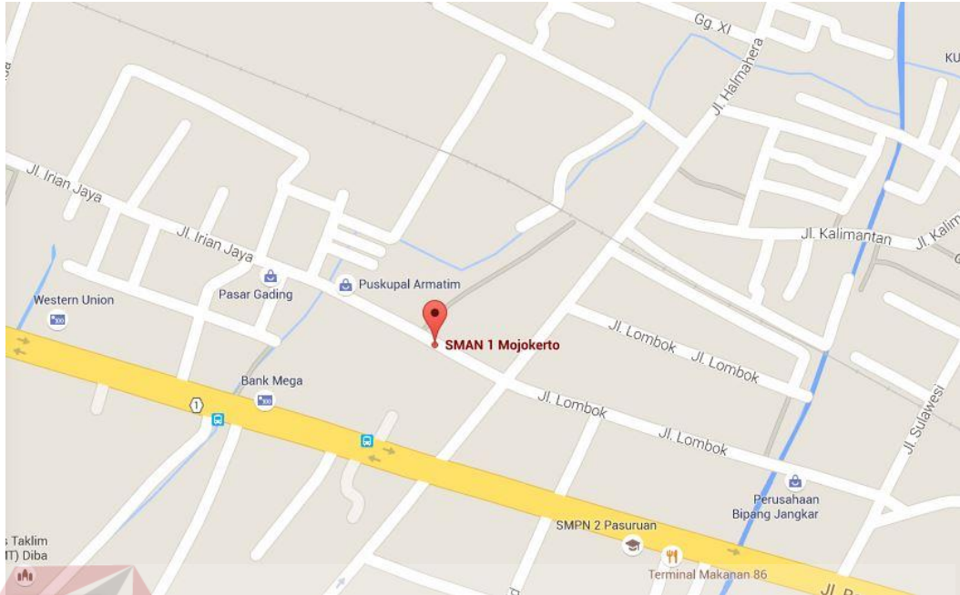
Gambar 2.1 Peta Lokasi Koperasi siswa