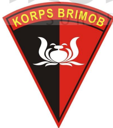
Gambar 2.2 Satbrimob