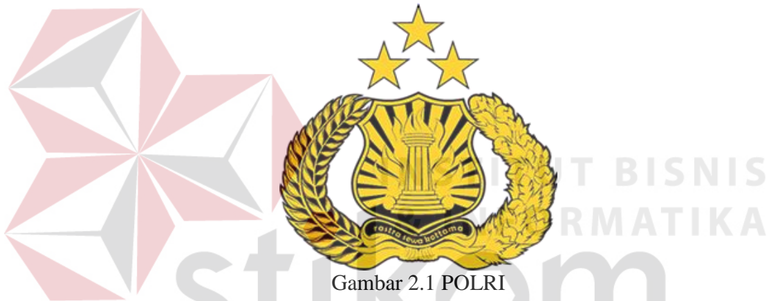
Gambar 2.1 POLRI

Sebuah logo akan menjadi suatu Brand Images dimana dari suatu Instansi. Sudah banyak Instansi – Instansi yang melakukan transformasi visi dan misi melalui logo..Logo POLRI dapat dilihat pada Gambar 2.1 dan logo Satbrimob dapat dilihat pada Gambar 2.2.