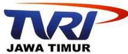
Gambar 2.1 Logo TVRI Jawa Timur