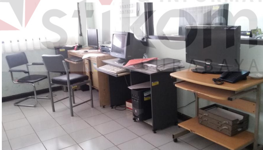
Gambar 2.6 Ruang Program TVRI Jawa Timur (Sumber : Olahan Penulis)