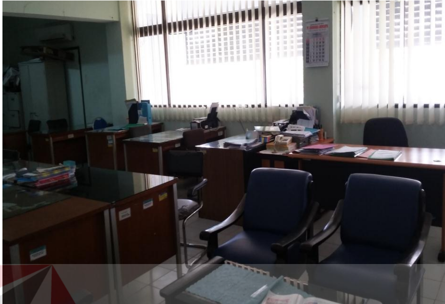
Gambar 2.5 Foto Ruang Program TVRI Jawa Timur