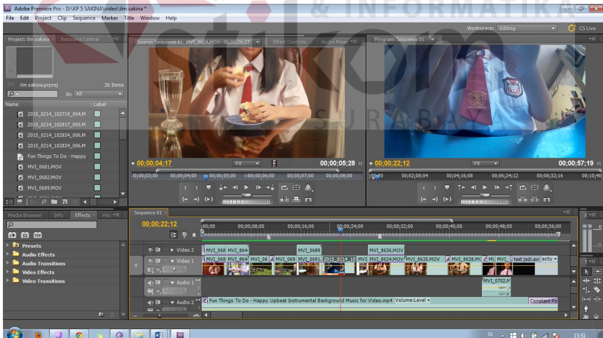
Gambar 5.3.1 Proses editing dan pemberian backsound