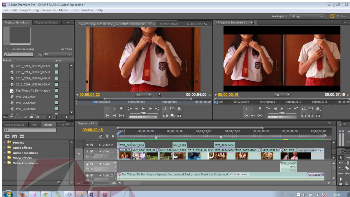
Gambar 5.3 Proses editing dan penyatuan stock shoot