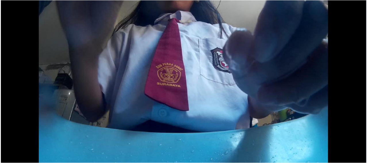
Gambar 5.2.1: Proses Produksi