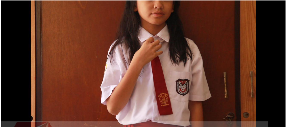
Gambar 5.2: Proses Produksi