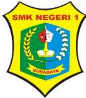
Gambar 2.1 Logo SMK NEGERI 1 Surabaya