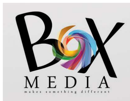
Gambar 2.4 Logo Box Media