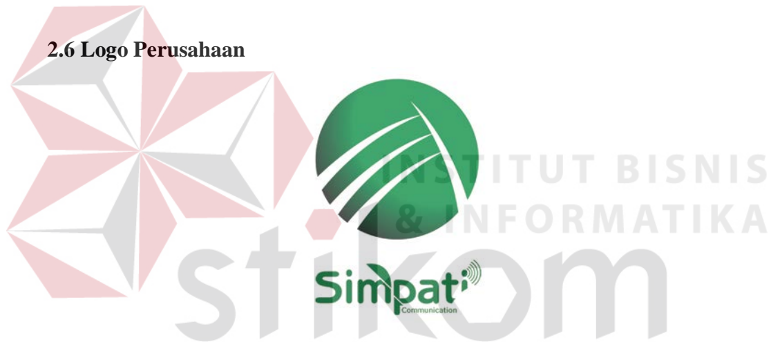
Gambar 2.3 Logo PT. Suara Mitra Simpati