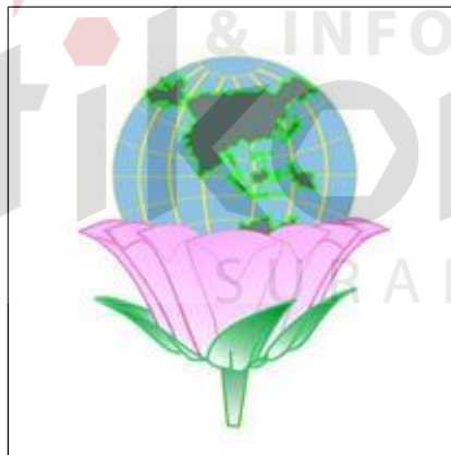
Gambar 2.1. Logo PT. GRLJI