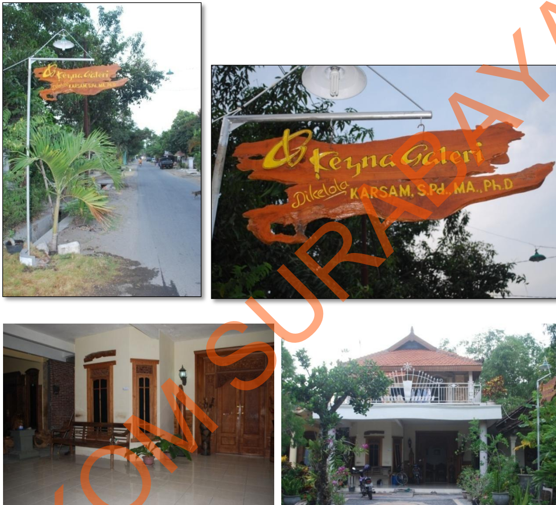
Gambar 4.2 Keyna Galeri Tampak dari Luar