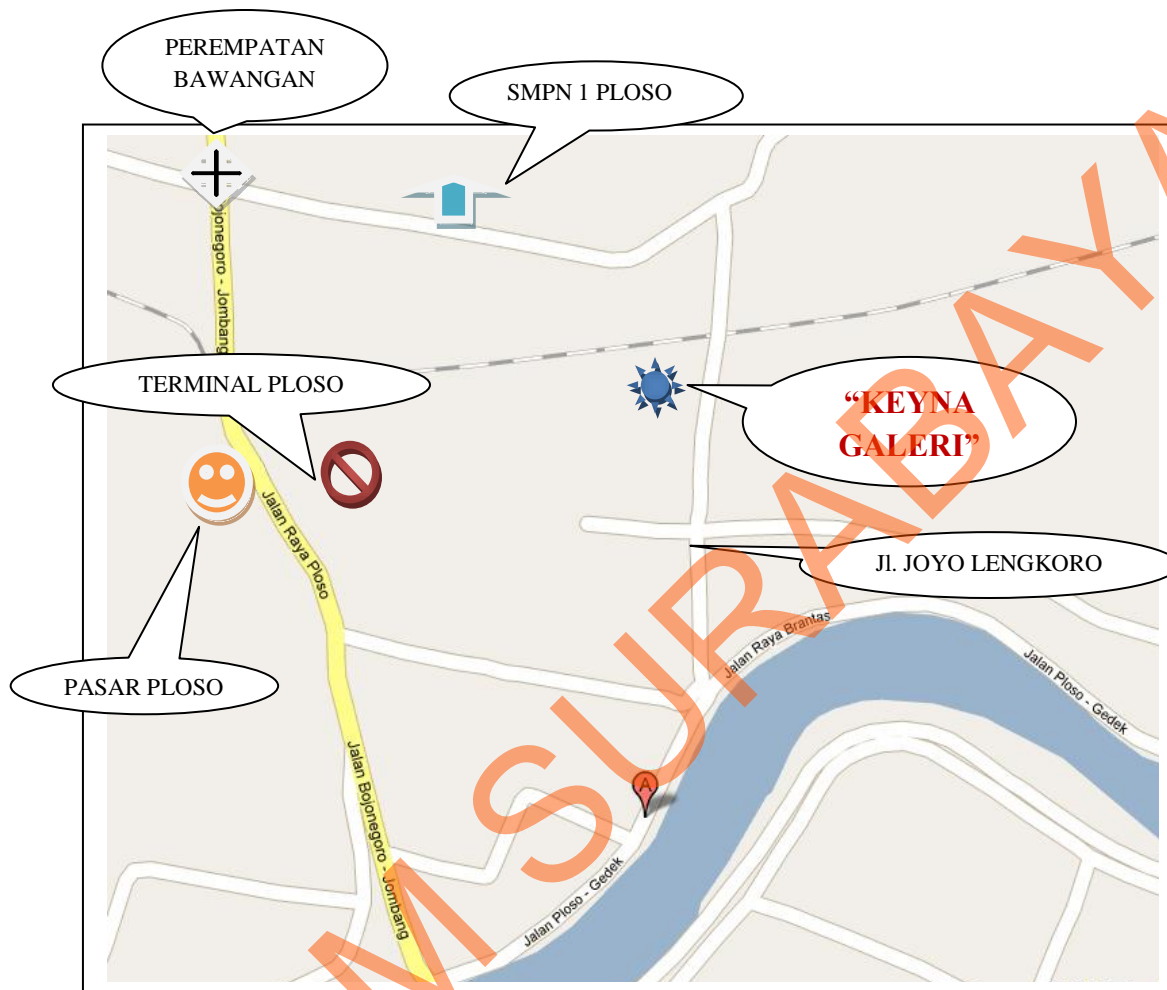
Gambar 4.1 Peta Keyna Galeri