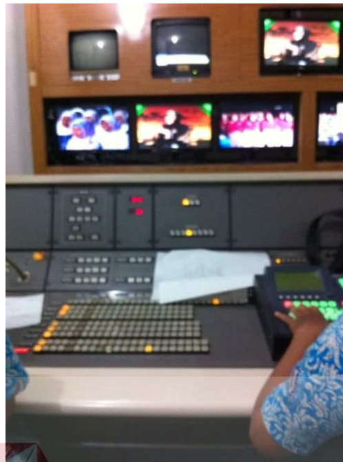
Gambar 2.6 Ruang Audio