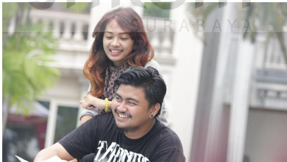
Gambar : 5.1 Sesi Latihan Sebelum Produksi

Sesi latihan adalah sesi dimana sebelum sesi produksi dilaksanakan. Didalam sesi latihan para pemain atau talent diberikan intruksi, pembagian naskah, serta latihan hingga gladi bersih sebelum sesi produksi dilakukan.