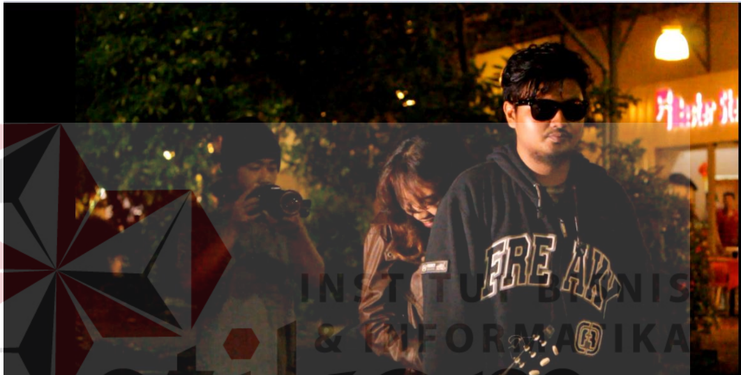
Gambar : 5.2 Produksi

Sesi produksi adalah sesi pengambilan gambar yang dilakukan setelah sesi latihan. Dimana para pemain atau talent telah dapat mengetahui dan menggambar berbagai adegan yang akan diperankan per adegan sesuai dengan syuting script yang telah dibuat.