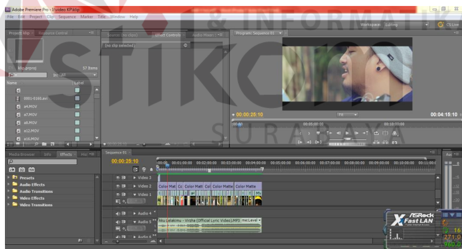
Gambar : 5.4 Proses Dubbing Suara