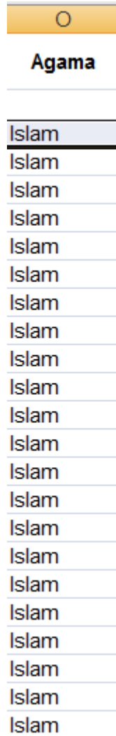
Gambar 4.16 Pengisian Kolom Agama