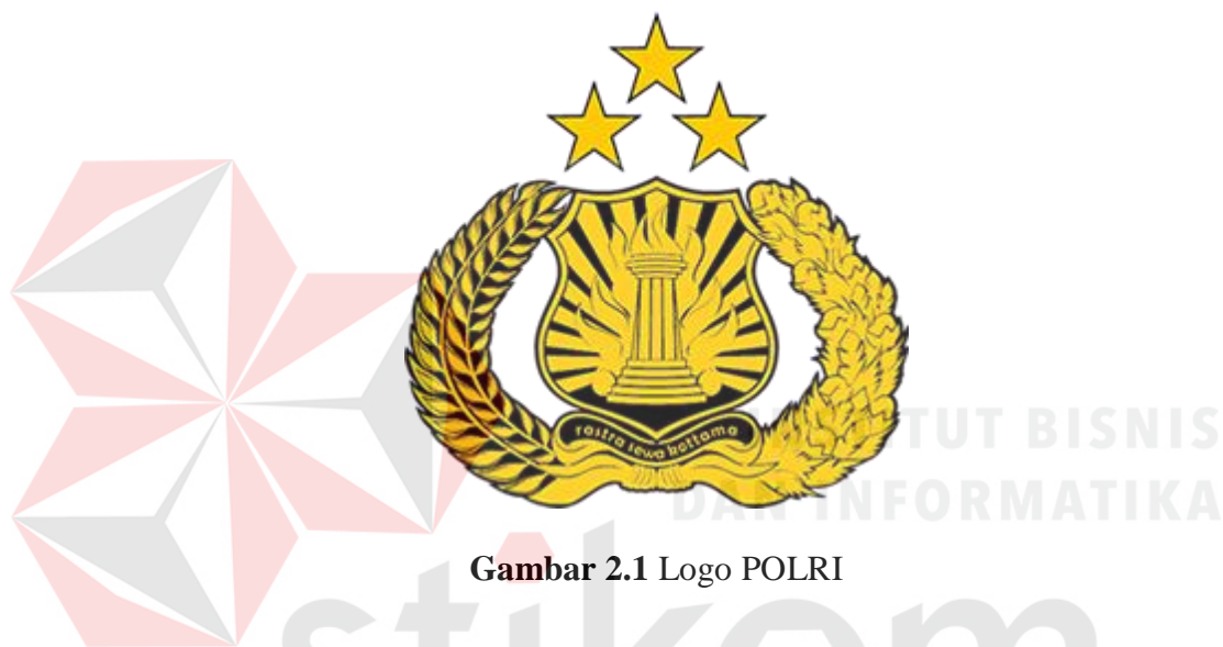
Gambar 2.1 Logo POLRI

Sebuah logo akan menjadi suatu Brand Images dimana dari suatu Instansi. Sudah banyak Instansi – Instansi yang melakukan transformasi visi dan misi melalui logo. Logo juga bersifat persepsi kuat terhadap perusahaan. Logo POLRI dapat dilihat pada Gambar 2.1