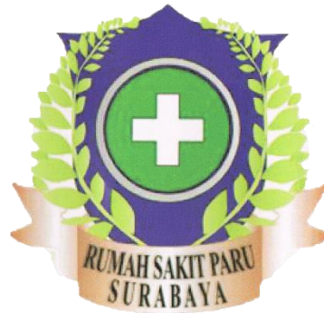
Gambar 2.1 Logo UPT Rumah Sakit Paru Surabaya