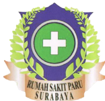
Gambar 2.1 Logo UPT Rumah Sakit Paru Surabaya