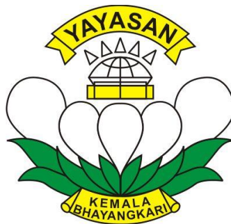
Gambar 2.1 Logo SMA Kemala Bhayangkari 1 Surabaya