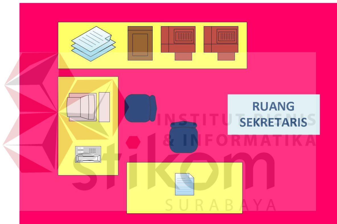
Gambar 2.4 Denah Ruang Sekretaris

Denah ruang sekretaris ini yakni menjelaskan tata letak ruangan sekretaris yang tepatnya berada di depan ruangan direktur dan presiden direktur agar memudahkan pimpinan, apabila membutuhkan sesuatu yang terkait pekerjaan pimpinan. Diruangan sekretaris terdapat printer, scanner, dan alat tulis kantor pendukung lainnya. Denah ruangan sekretaris dapat dilihat pada gambar 2.4