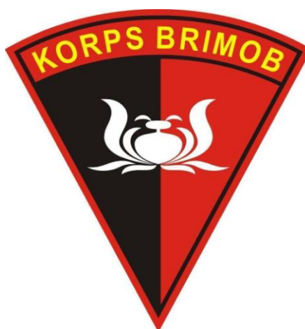
Gambar 2.2 SATBRIMOB POLDA JATIM