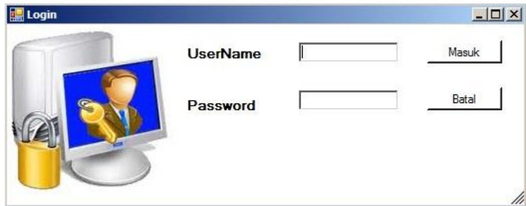
Gambar 5.2 Form Login

Form login ini adalah form yang digunakan oleh pengguna agar dapat mengakses lebih lanjut dari aplikasi. Dalam form ini pengguna diwajibkan untuk memasukkan username dan password agar dapat ke proses berikutnya.