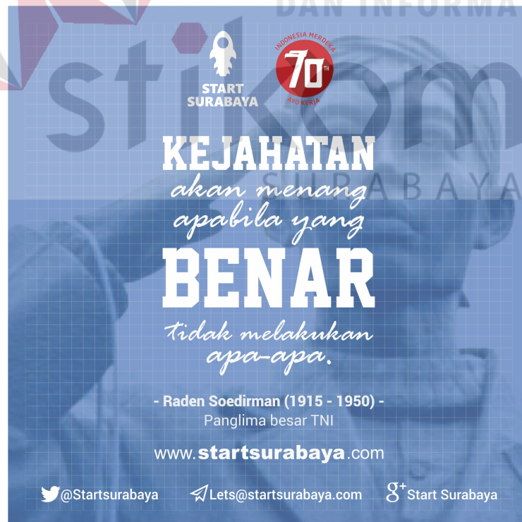
Gambar 4.12 Poster quote spesial hari kemerdekaan Indonesia