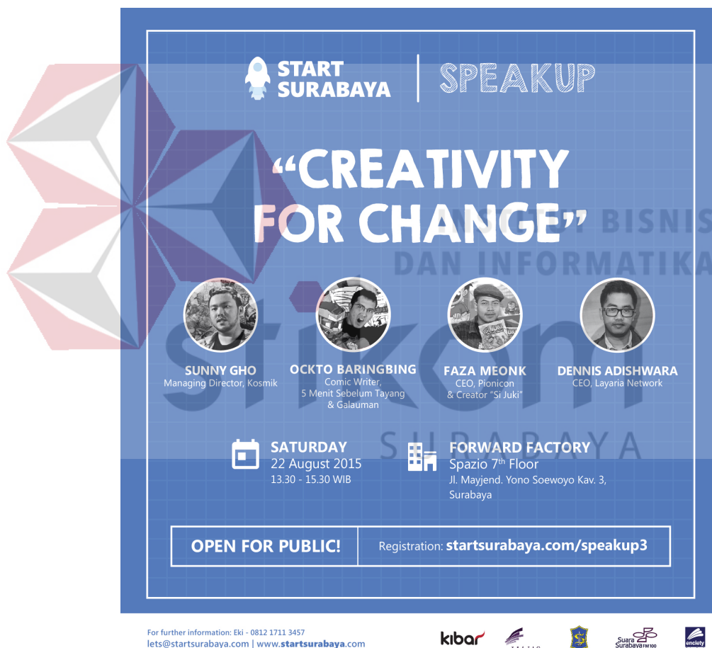
Gambar 4.1 Poster Speakup