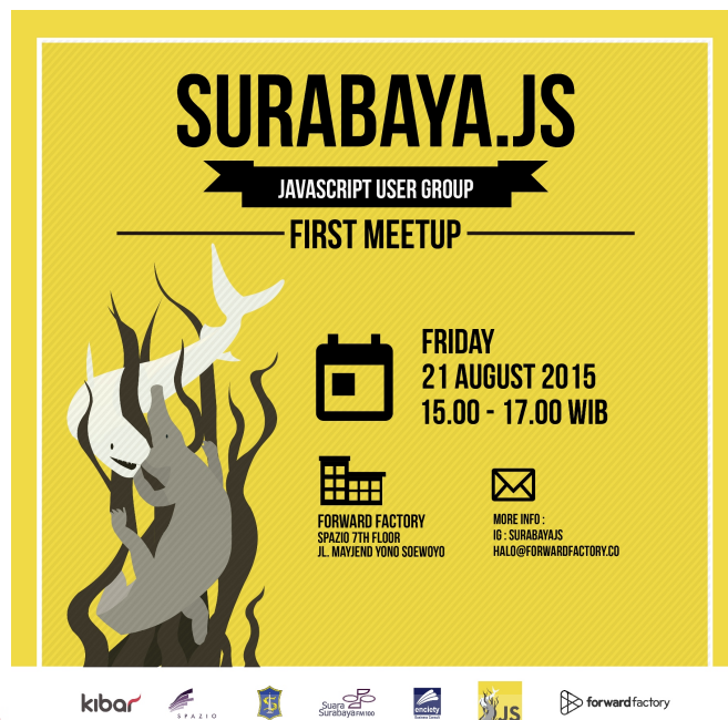
Gambar 4.6 Poster Surabaya Java Script MeetUp