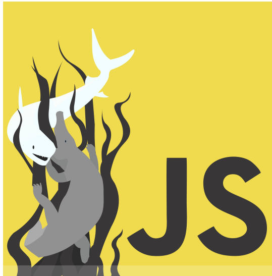
Gambar 4.5 Logo Surabaya Java Script