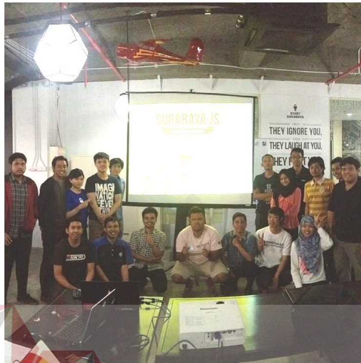
Gambar 4.6 Dokumentasi Surabaya Java Script MeetUp