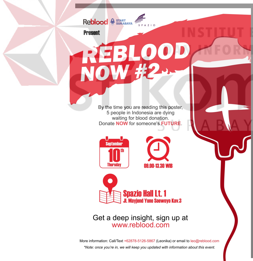
Gambar 4.3 Poster Reblood Now #2