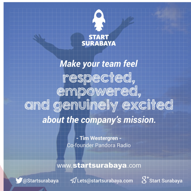
Gambar 4.9 Poster quote 3