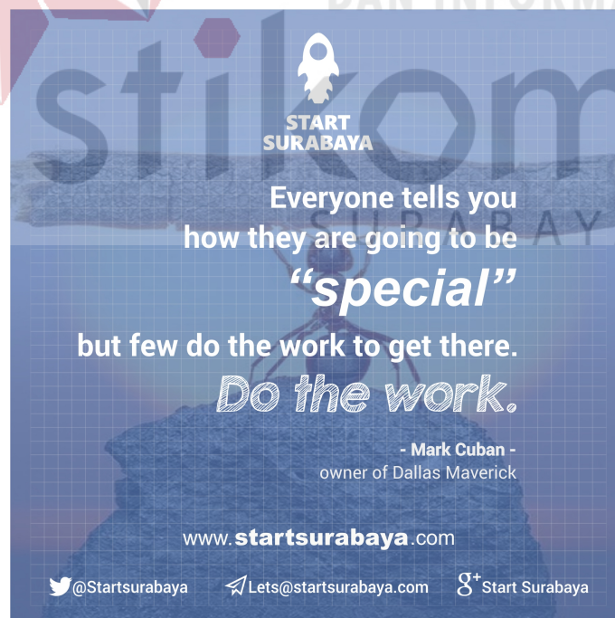
Gambar 4.10 Poster quote 4