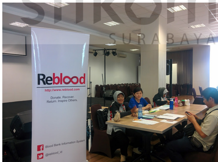
Gambar 4.4 Dokumentasi Reblood Now #2

Dibawah judul poster ini terdapat kata-kata yang dapat memotivasi calon pendonor untuk bersedia mendonorkan darahnya. Selain itu poster ini juga berisi informasi mengenai tanggal, lokasi dan waktu penyelenggaraan acara serta cara berpartisipasi pada acara tersebut.