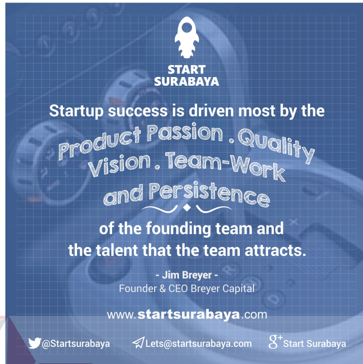
Gambar 4.11 Poster quote 5