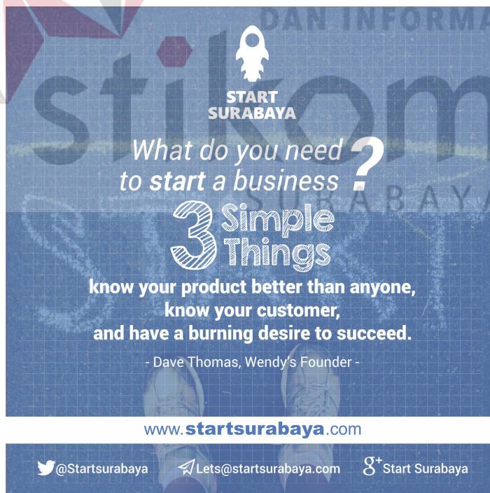
Gambar 4.8 Poster quote 2